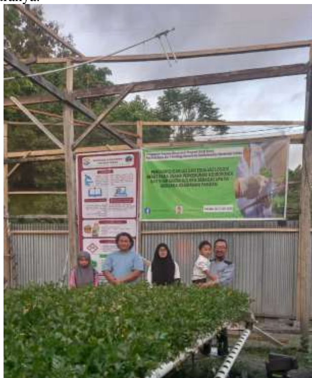
Gambar 6. Sesi foto bersama di akhir kegiatan

Kegiatan pengabdian ini diharapkan menjadi langkah awal bagi kebun Hidroponik Say Your Green untuk menjadi percontohan kebun urban di Kabupaten Kolaka yang berwawasan lingkungan dan menjamin keamanan produk hortikulturanya.