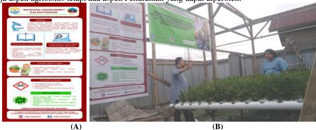
Gambar 3. Desain poster Bahaya Logam Berat (A) dan Proses pemaparan materi poster logam berat (B)

Kegiatan ini dimulai dari diskusi singkat terkait profil kebun dan manajemen kebun termasuk aspek produksi, pemeliharaan, dan penjualan komoditi sayur yang dihasilkan. Setelah itu, narasumber mulai memberikan edukasi logam berat yang disampaikan melalui media poster yang dipasang dalam area kebun. Berdasarkan hasil diskusi, pemilik kebun masih memiliki pengetahuan yang minim terkait logam berat terutama aspek regulasi bahaya dan ambang batas yang ditolerir dalam komoditi sayuran yang berlaku di Indonesia serta aspek pengujian logam berat pada sayuran segar. Hal ini terungkap saat sesi diskusi yang berlangsung antara pemilik kebun dan narasumber (Gambar 3). Pada sesi diskusi interaktif, pemilik kebun menyatakan belum mengetahui kadar toleransi logam berat pada sayuran terutama pada sayuran hidroponik. Selain itu, pemilik kebun juga belum mengetahui bagaimana alur pengujian logam berat sayuran yang sesuai prosedur. Berdasarkan penelitian sebelumnya, penggunaan poster sebagai media edukasi dinilai cukup efektif karena bahasa yang digunakan cukup singkat dan mudah dipahami, efisien, praktis, visualnya menarik sehingga mudah diingat (Ayu et al., 2024; Maharudin & Iryanti, 2021). Selain itu, penggunaan media poster ini dapat menjamin transformasi pengetahuan secara berkelanjutan bagi pemilik usaha Perkebunan bagi pengunjung kebun dari berbagai kalangan sehingga dalam area Perkebunan hidroponik, bukan saja aspek agribisnis tetapi ada aspek Pendidikan yang dapat diperoleh.