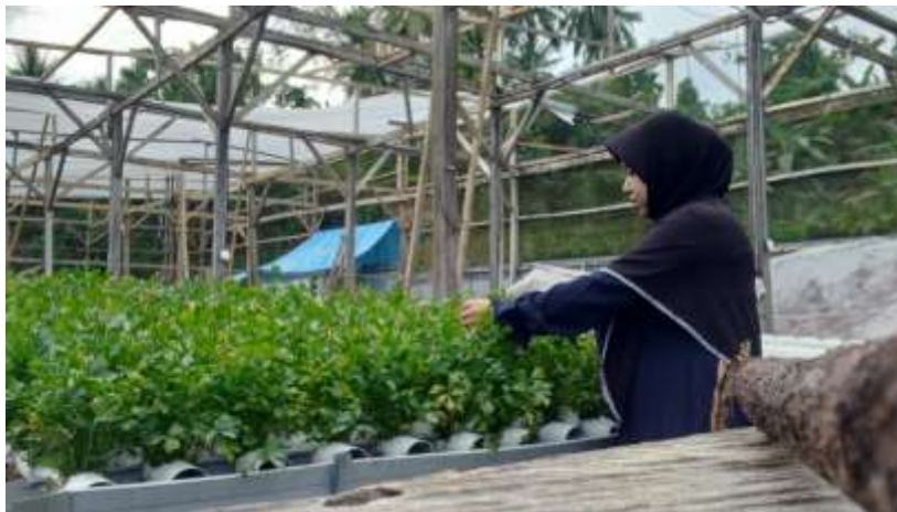
Gamba 4. Pengambilan sampel sayur seledri

Pengambilan sampel sayur seledri (Gambar 4) yang dibudidayakan di Kebun Say Your Green dilakukan pada hari kedua. Dari beberapa komoditas yang tersedia, hanya sayur seledri yang siap diuji, untuk komoditi sayur yang lain masih dalam tahap penyemaian. Pengambilan sampel dilakukan secara representatif dari beberapa petak tanam untuk memastikan hasil yang akurat. Sampel kemudian dikirim dan diuji di laboratorium Dasar Universitas Halu Oleo menggunakan instrumentasi ICP-OES untuk mengetahui keberadaan dan kadar logam timbal (Pb). Hasil uji laboratorium menunjukkan bahwa Kadar Pb pada sayur seledri berada di bawah ambang batas maksimum yang ditetapkan oleh BPOM (Badan Pengawas Obat dan Makanan), yaitu 0,3 mg/kg (Gambar 5). Dengan demikian, produk seledri yang dihasilkan di kebun hidroponik Say Your Green dinyatakan aman untuk dikonsumsi dan bebas dari cemaran logam Pb. Hasil ini menjadi indikator penting bahwa praktik budidaya di Kebun Say Your Green sudah menerapkan prinsip-prinsip keamanan pangan yang baik, khususnya dalam aspek pemilihan media tanam dan sumber air yang bebas kontaminasi.