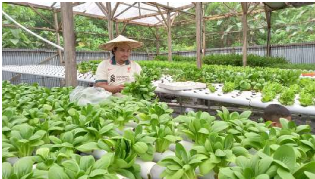
Gambar 2. Lokasi kebun hidroponik Say Your Green Kabupaten Kolaka