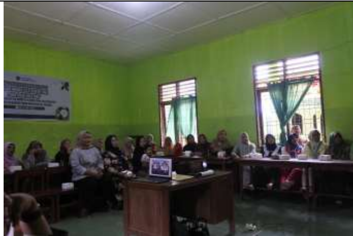
Gambar 4. Peserta yaitu orang tua

Pada hari pertama, setelah sesi pengenalan konsep screen time , peserta memperoleh materi kedua yang membahas dampak positif dan negatif media digital terhadap anak usia dini. Materi ini disampaikan dengan menekankan empat aspek perkembangan anak yang paling terdampak oleh penggunaan gawai, yaitu fisik, perilaku, kognitif, serta sosial-emosional. Dari aspek fisik, dijelaskan bahwa penggunaan gawai secara berlebihan dapat menimbulkan gangguan pada kesehatan mata, pola tidur, serta menurunkan aktivitas motorik anak. Pada aspek perilaku, anak berpotensi meniru perilaku agresif atau konsumtif dari konten digital yang tidak sesuai, meskipun terdapat peluang bagi orang tua untuk memanfaatkan media digital sebagai sarana pembiasaan perilaku positif. Dari sisi kognitif, media digital dipaparkan dapat memperkaya pengetahuan dan melatih keterampilan berpikir, tetapi paparan berlebihan dapat mengganggu konsentrasi dan kemampuan fokus anak. Sementara itu, pada aspek sosial-emosional, screen time yang tidak terkendali berisiko mengurangi intensitas interaksi tatap muka dengan keluarga maupun teman sebaya, sedangkan pemanfaatan yang tepat dapat mendukung stimulasi emosi dan interaksi yang sehat. Pemateri menegaskan bahwa orang tua memiliki peran sentral dalam mendampingi anak, baik melalui pengawasan terhadap konten maupun pengaturan pola penggunaan perangkat digital, sehingga manfaat media digital dapat dimaksimalkan tanpa mengabaikan potensi risikonya.