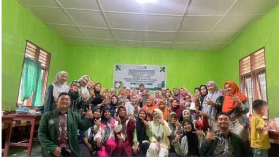
Gambar 2. Foto bersama dengan peserta

Pelaksanaan kegiatan pengabdian berupa workshop dilaksanakan selama dua hari pada 16–17 Juni 2025 dengan tujuan utama meningkatkan kesadaran dan pemahaman para orang tua terkait isu screen time pada anak. Kegiatan ini dirancang tidak hanya untuk menyampaikan pengetahuan, tetapi juga untuk membangun ruang dialog dan refleksi bersama. Secara umum, materi yang diberikan meliputi pengenalan konsep screen time , pemahaman tentang dampak positif maupun negatif penggunaan media digital, serta pentingnya peran orang tua dalam mengelola durasi dan kualitas penggunaan gawai oleh anak.