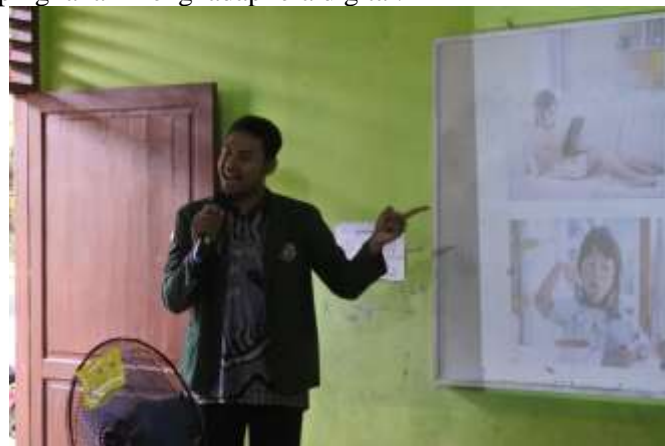
Gambar 3. Pemaparan materi 1

Sejalan dengan pengabdian ini, pengabdian (Sumantiawan, Nurvita, and Chotimah 2024) juga menemukan bahwa edukasi interaktif mengenai fungsi gadget, pengaturan durasi layar, serta refleksi penerapan terbukti efektif meningkatkan kesadaran masyarakat akan bahaya screen time dan pola hidup sehat. Selain itu, diskusi interaktif juga menjadi bagian penting dari kegiatan, di mana para orang tua berkesempatan untuk berbagi pengalaman, menyampaikan tantangan yang mereka hadapi sehari-hari, serta mendiskusikan kemungkinan solusi yang dapat diterapkan. Dengan pendekatan partisipatif ini, workshop tidak hanya berfungsi sebagai transfer pengetahuan, tetapi juga sebagai wadah untuk memperkuat kapasitas orang tua dalam mendampingi anak menghadapi era digital.