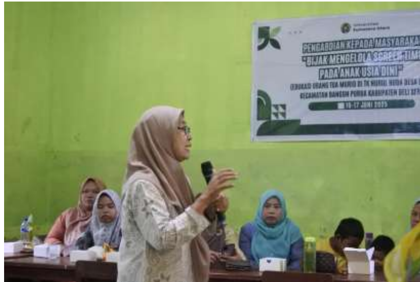
Gambar 6. Pemaparan materi hari kedua

Temuan ini sejalan dengan (Rosyada and Ramadhianti 2019) yang menekankan bahwa pengelolaan screen time tidak hanya sebatas membatasi durasi penggunaan media digital, tetapi juga harus diiringi dengan pola komunikasi positif dari orang tua. Penggunaan bahasa positif dalam mendampingi anak menjadi salah satu kunci dalam membangun karakter yang lebih baik. Dengan demikian, edukasi kepada orang tua melalui kegiatan pengabdian ini tidak hanya memberikan pemahaman tentang pentingnya pembatasan screen time, tetapi juga mendorong mereka untuk menghadirkan pola asuh yang lebih suportif dan membangun dalam interaksi sehari-hari.