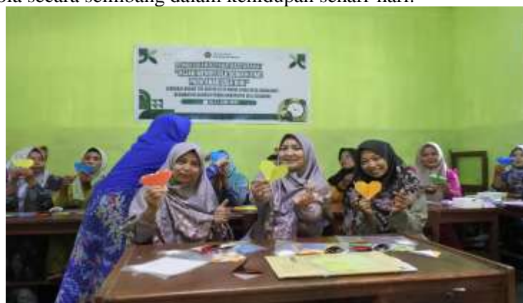
Gambar 7. Pembuatan origami

Pemateri menjelaskan berbagai pengaruh screen time terhadap anak, baik dari sisi perkembangan fisik maupun psikososial, sekaligus memberikan strategi praktis yang dapat dilakukan orang tua untuk mengatasi dampak negatif yang mungkin muncul. Selain itu, disampaikan pula panduan mengenai pengaturan durasi screen time yang ideal sesuai dengan kelompok usia anak berdasarkan rekomendasi Ikatan Dokter Anak Indonesia (Asmayawati 2023). Dengan adanya panduan tersebut, orang tua diharapkan mampu menetapkan batasan yang realistis, konsisten, dan sesuai dengan kebutuhan perkembangan anak, sehingga penggunaan media digital dapat dikelola secara seimbang dalam kehidupan sehari-hari.