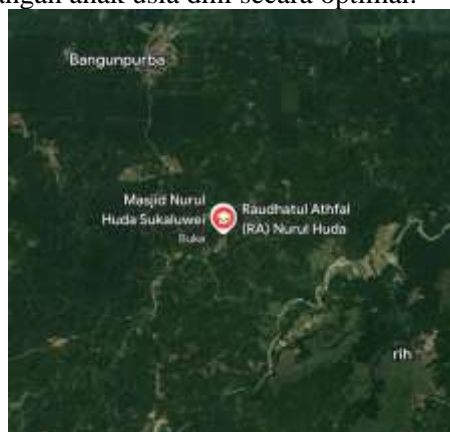
Gambar 1. TK Nurul Huda, Sukaluwei

Kegiatan Pengabdian kepada Masyarakat (PKM) dilaksanakan di TK Nurul Huda, yang terletak di desa Sukaluwei, Kecamatan Bangun Purba, Deli Serdang. Masalah utama yang dihadapi dalam kegiatan Pengabdian kepada Masyarakat (PKM) Banyak orang tua belum memiliki pemahaman dan keterampilan yang memadai dalam mengelola penggunaan media digital anak, sehingga screen time sering kali melebihi batas yang direkomendasikan. Kondisi ini berdampak pada perkembangan sosial, emosional, dan kesehatan anak, seperti kesulitan berinteraksi, kecenderungan individualis, serta risiko perilaku hiperaktif. Minimnya pengawasan juga membuat anak rentan terpapar konten yang tidak sesuai usia. Hasil observasi dan diskusi dengan pihak sekolah dan orang tua menunjukkan perlunya program edukasi untuk meningkatkan kesadaran dan peran orang tua dalam membatasi screen time , sejalan dengan SDGs 4 (Pendidikan Berkualitas) yang menekankan pentingnya pengembangan anak usia dini secara optimal.