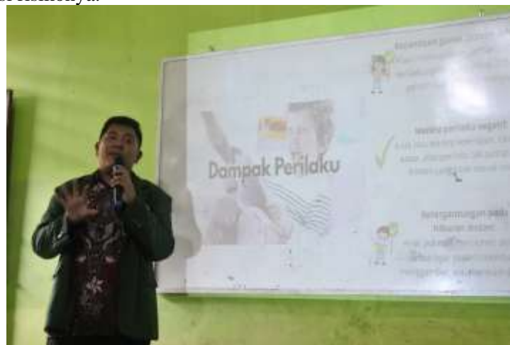
Gambar 5. Pemaparan materi kedua

Pada hari pertama, setelah sesi pengenalan konsep screen time , peserta memperoleh materi kedua yang membahas dampak positif dan negatif media digital terhadap anak usia dini. Materi ini disampaikan dengan menekankan empat aspek perkembangan anak yang paling terdampak oleh penggunaan gawai, yaitu fisik, perilaku, kognitif, serta sosial-emosional. Dari aspek fisik, dijelaskan bahwa penggunaan gawai secara berlebihan dapat menimbulkan gangguan pada kesehatan mata, pola tidur, serta menurunkan aktivitas motorik anak. Pada aspek perilaku, anak berpotensi meniru perilaku agresif atau konsumtif dari konten digital yang tidak sesuai, meskipun terdapat peluang bagi orang tua untuk memanfaatkan media digital sebagai sarana pembiasaan perilaku positif. Dari sisi kognitif, media digital dipaparkan dapat memperkaya pengetahuan dan melatih keterampilan berpikir, tetapi paparan berlebihan dapat mengganggu konsentrasi dan kemampuan fokus anak. Sementara itu, pada aspek sosial-emosional, screen time yang tidak terkendali berisiko mengurangi intensitas interaksi tatap muka dengan keluarga maupun teman sebaya, sedangkan pemanfaatan yang tepat dapat mendukung stimulasi emosi dan interaksi yang sehat. Pemateri menegaskan bahwa orang tua memiliki peran sentral dalam mendampingi anak, baik melalui pengawasan terhadap konten maupun pengaturan pola penggunaan perangkat digital, sehingga manfaat media digital dapat dimaksimalkan tanpa mengabaikan potensi risikonya.