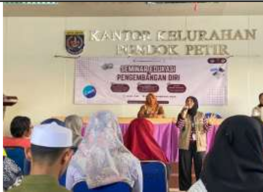
Gambar 6. Pemaparan Materi

Antusiasme peserta semakin terlihat pada sesi praktek ini. Peserta diarahkan langsung untuk mencoba membuat desain sederhana menggunakan Canva melalui Handphone masing-masing dengan bimbingan serta arahan dari pemateri serta teman-teman KKN lainnya, misalnya poster jadwal kegiatan posyandu, flyer ajakan imunisasi, atau pamflet gizi seimbang. Melalui praktik ini, peserta dapat menerapkan materi yang telah disampaikan, sehingga pengalaman belajar menjadi lebih konkret dan aplikatif. Beberapa peserta bahkan menunjukkan kreativitasnya dalam mendesain media informasi posyandu yang lebih menarik untuk disebarakan kepada masyarakat.