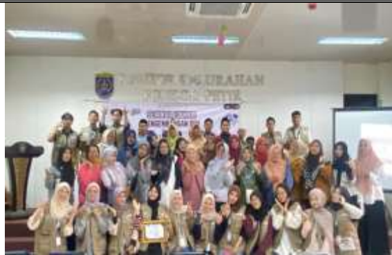
Gambar 9. Sesi Dokumentasi

Pada tahap akhir, panitia melakukan evaluasi terhadap jalannya acara mulai dari persiapan, pembukaan, penyampaian materi, sesi praktik, hingga penutupan. Hasil evaluasi menunjukkan bahwa kegiatan berjalan lancar sesuai dengan jadwal, dengan tingkat partisipasi yang tinggi. Secara umum, pelatihan ini dinilai berhasil karena mampu memberikan pengetahuan, keterampilan, sekaligus pengalaman praktis kepada peserta dalam memanfaatkan aplikasi Canva untuk membuat media informasi posyandu yang lebih kreatif, edukatif, dan bermanfaat bagi masyarakat.