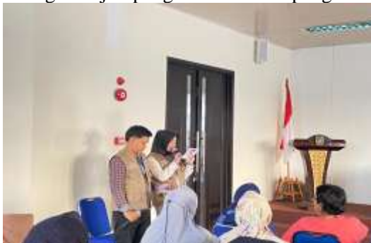
Gambar 4. Dokumentasi Pembukaan

Setelah seluruh peserta memasuki ruangan, kegiatan resmi dibuka oleh MC, kemudian dilanjutkan dengan menyanyikan Lagu Indonesia Raya sebagai wujud penghormatan dan penguatan semangat kebangsaan.