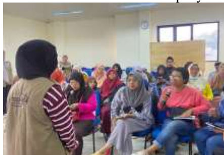
Gambar 8. Sesi Tanya Jawab

Setelah sesi praktek, kegiatan dilanjutkan dengan sesi tanya jawab. Peserta tampak antusias mengajukan pertanyaan, terutama terkait cara membuat poster jadwal posyandu yang informatif namun tetap menarik, teknik mengatur tata letak desain agar mudah dibaca, serta strategi menyebarkan hasil desain ke media sosial atau grup masyarakat. Narasumber memberikan penjelasan yang mudah dipahami, sehingga menambah wawasan peserta mengenai optimalisasi Canva untuk kebutuhan posyandu.