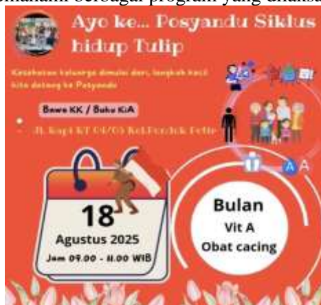
Gambar 1. Contoh poster yang dibuat oleh ibu kader posyandu keluaran pondok petir

Di Kelurahan Pondok Petir, Kota Depok, terdapat 19 Posyandu yang aktif beroperasi dan berperan penting dalam mendukung pelayanan kesehatan masyarakat. Kader Posyandu, khususnya para ibu kader, memiliki peran yang sangat penting dalam membantu penyampaian informasi dan edukasi kesehatan kepada masyarakat. Salah satu bentuk peran tersebut diwujudkan melalui penyusunan poster yang digunakan sebagai media komunikasi visual. Poster tidak hanya dimanfaatkan untuk menyampaikan pesan-pesan kesehatan, tetapi juga berfungsi sebagai sarana informasi mengenai pelaksanaan Posyandu, seperti jadwal kegiatan, lokasi, serta jenis layanan yang tersedia. Dengan adanya poster, masyarakat diharapkan lebih mudah memperoleh informasi sekaligus memahami berbagai program yang dilaksanakan Posyandu.