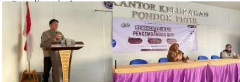
Gambar 5. Sambutan oleh Perangkat Kelurahan dan Ketua KKN

Setelah pembukaan, acara dilanjutkan dengan sambutan dari perangkat kelurahan Pondok Petir yang menyampaikan apresiasi sekaligus memberikan dukungan penuh terhadap pelatihan ini, karena dinilai bermanfaat dalam membantu masyarakat memperoleh media informasi posyandu yang lebih menarik dan mudah dipahami. Sambutan berikutnya disampaikan oleh Ketua KKN yang menekankan pentingnya kegiatan ini dalam meningkatkan keterampilan masyarakat dalam memanfaatkan teknologi digital, khususnya untuk mendukung keberlangsungan kegiatan posyandu.