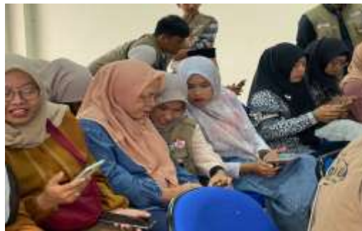
Gambar 7. Sesi Praktek

Antusiasme peserta semakin terlihat pada sesi praktek ini. Peserta diarahkan langsung untuk mencoba membuat desain sederhana menggunakan Canva melalui Handphone masing-masing dengan bimbingan serta arahan dari pemateri serta teman-teman KKN lainnya, misalnya poster jadwal kegiatan posyandu, flyer ajakan imunisasi, atau pamflet gizi seimbang. Melalui praktik ini, peserta dapat menerapkan materi yang telah disampaikan, sehingga pengalaman belajar menjadi lebih konkret dan aplikatif. Beberapa peserta bahkan menunjukkan kreativitasnya dalam mendesain media informasi posyandu yang lebih menarik untuk disebarakan kepada masyarakat.