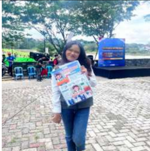
Gambar 5 Dokumentasi bersama poster edukasi

Sosialisasi anti-bullying dilaksanakan melalui permainan interaktif, yel-yel, dan pemaparan materi disertai diskusi pengalaman pribadi siswa. Berdasarkan hasil observasi dan wawancara singkat dengan guru pendamping, sebagian besar siswa menunjukkan antusiasme tinggi selama kegiatan. Setelah sosialisasi, sebanyak 80% siswa mampu mengidentifikasi bentuk-bentuk bullying, sedangkan 70% siswa memahami bahwa ejekan dan pengucilan merupakan perilaku yang merugikan teman sebaya. Selain itu, 65% siswa menyatakan siap menegur atau melapor kepada guru jika melihat tindakan bullying di lingkungan sekolah. Sementara itu, untuk kegiatan PHBS, sosialisasi dilakukan melalui pemaparan materi, poster edukatif, serta praktik langsung menjaga kebersihan diri dan kelas. Setelah kegiatan berlangsung, guru mencatat adanya peningkatan kebiasaan mencuci tangan dan membuang sampah pada tempatnya. Sebanyak 75% siswa mulai menerapkan kebiasaan mencuci tangan sebelum makan, dan 68% ikut aktif menjaga kebersihan lingkungan kelas. Secara keseluruhan gambaran hasil kegiatan sosialisasi ini ditunjukkan pada Tabel 1.