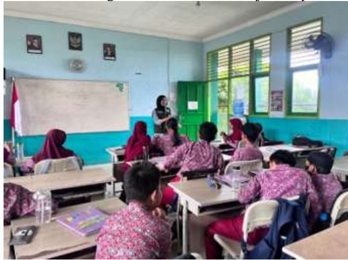
Gambar 1. Sosialisasi pencegahan Bullying dengan pembiasaan PHBS bagi siswa Sekolah Dasar

(PHBS) di sekolah belum berjalan optimal; sebagian siswa belum terbiasa menjaga kebersihan diri dan lingkungan serta kurang memahami kaitan antara hidup sehat dan perilaku sosial yang positif (Anggreyni et al., 2025). Kondisi ini menunjukkan perlunya kegiatan pengabdian yang mengintegrasikan edukasi anti-bullying dengan pembiasaan PHBS untuk membentuk karakter peduli, disiplin, dan empatik di lingkungan sekolah. Kondisi sekolah sasaran dalam kegiatan sosialisasi ini ditunjukkan pada Gambar. 1.