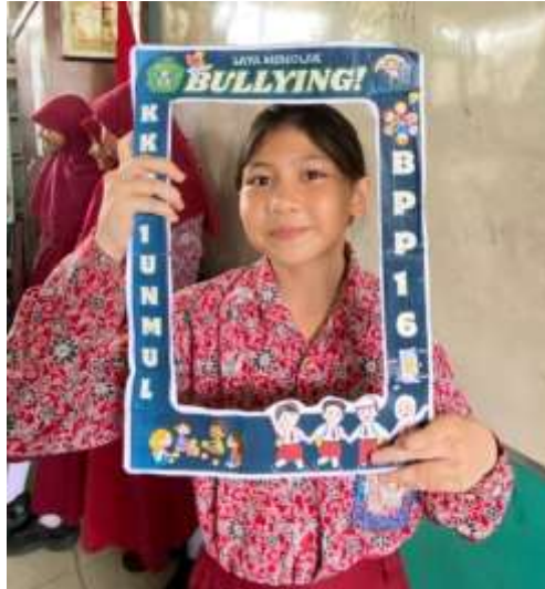
Gambar 2. Foto dengan bingkai "Saya Menolak Bullying"

yaitu fisik, verbal, sosial, dan digital ( cyberbullying ). Contoh konkret diberikan untuk memudahkan pemahaman, misalnya mengejek teman karena penampilan, memanggil dengan sebutan orang tua, mengambil barang tanpa izin, atau mengucilkan teman saat bermain.