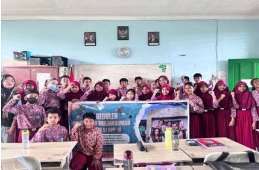
Gambar 3. Sesi foto bersama dengan seluruh siswa

Sementara itu, sosialisasi Perilaku Hidup Bersih dan Sehat (PHBS) dilaksanakan di masyarakat dengan pendekatan partisipatif melalui pemaparan materi interaktif menggunakan media poster edukatif. Poster memuat pengertian, tujuan, contoh, dan manfaat PHBS, sehingga lebih mudah dipahami oleh peserta. Gambar 4 menunjukkan penyampaian materi inti disampaikan dengan bahasa sederhana yang dekat dengan kehidupan sehari-hari, seperti kebiasaan mandi dua kali sehari, mencuci tangan pakai sabun sebelum makan dan setelah buang air, menjaga kebersihan rumah, serta mengonsumsi makanan bergizi seimbang. Penekanan juga diberikan pada manfaat PHBS, antara lain tubuh lebih sehat, lingkungan lebih nyaman, serta meningkatnya semangat dalam beraktivitas. Setelah materi disampaikan, kegiatan dilanjutkan dengan sesi tanya jawab, di mana peserta diberi kesempatan mengajukan pertanyaan terkait penerapan PHBS dalam kehidupan sehari-hari. Gambar 5 menunjukkan kampanye positif, kegiatan ditutup dengan foto bersama menggunakan poster bertema “ Bersih Diri, Sehat Negeri ” yang diharapkan dapat menjadi pengingat sekaligus motivasi warga untuk terus membudayakan PHBS.