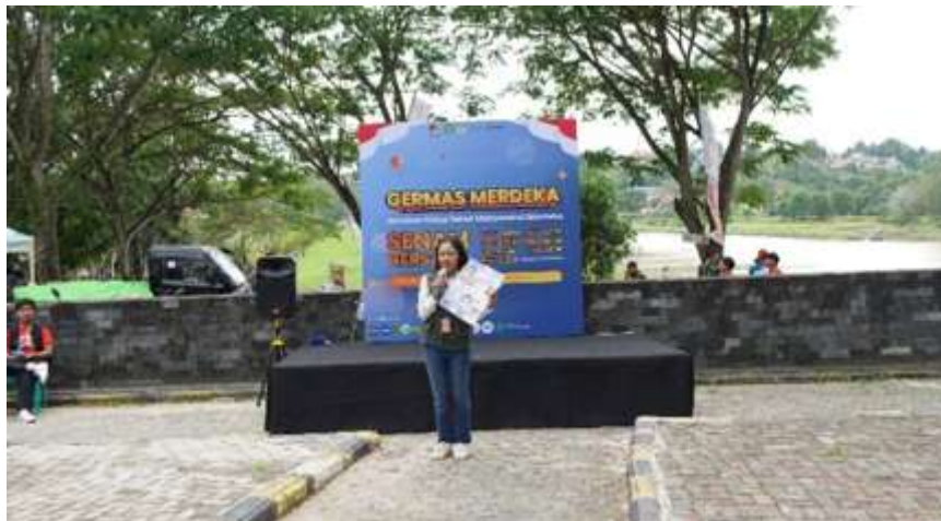
Gambar 4. Pemaparan materi sosialisasi PHBS.

Sementara itu, sosialisasi Perilaku Hidup Bersih dan Sehat (PHBS) dilaksanakan di masyarakat dengan pendekatan partisipatif melalui pemaparan materi interaktif menggunakan media poster edukatif. Poster memuat pengertian, tujuan, contoh, dan manfaat PHBS, sehingga lebih mudah dipahami oleh peserta. Gambar 4 menunjukkan penyampaian materi inti disampaikan dengan bahasa sederhana yang dekat dengan kehidupan sehari-hari, seperti kebiasaan mandi dua kali sehari, mencuci tangan pakai sabun sebelum makan dan setelah buang air, menjaga kebersihan rumah, serta mengonsumsi makanan bergizi seimbang. Penekanan juga diberikan pada manfaat PHBS, antara lain tubuh lebih sehat, lingkungan lebih nyaman, serta meningkatnya semangat dalam beraktivitas. Setelah materi disampaikan, kegiatan dilanjutkan dengan sesi tanya jawab, di mana peserta diberi kesempatan mengajukan pertanyaan terkait penerapan PHBS dalam kehidupan sehari-hari. Gambar 5 menunjukkan kampanye positif, kegiatan ditutup dengan foto bersama menggunakan poster bertema “ Bersih Diri, Sehat Negeri ” yang diharapkan dapat menjadi pengingat sekaligus motivasi warga untuk terus membudayakan PHBS.