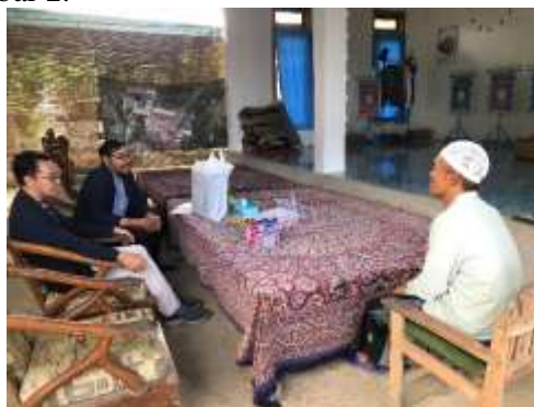
Gambar 2. Proses Wawancara

Kegiatan pengabdian dimulai dengan tahap pengumpulan data yang dilakukan untuk memahami kebutuhan dan situasi yang ada di Pondok Pesantren At-Tablighiyah. Proses pengumpulan data dilakukan melalui wawancara secara langsung dengan pengurus pondok pesantren. Wawancara ini bertujuan untuk menggali informasi terkait potensi dan kebutuhan keterampilan digital yang ada di kalangan santri, terutama dalam hal pengembangan kewirausahaan digital yang dapat mendukung usaha-usaha pondok pesantren. Dari hasil wawancara ini, diperoleh target pelaksanaan pelatihan dan gambaran tentang kurangnya keterampilan digital yang dimiliki oleh santri, yang kemudian menjadi dasar untuk merancang pelatihan yang sesuai. Proses wawancara dapat dilihat pada gambar 2.