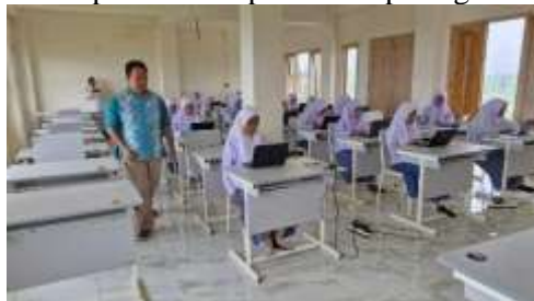
Gambar 3. Pelaksanaan Pelatihan

Setelah pengumpulan data selesai, langkah selanjutnya adalah pelatihan pembuatan website yang disesuaikan dengan temuan dari wawancara tersebut. Pelatihan ini ditujukan untuk para siswa-siswi kelas 3 SMK PP At-Tablighiyah sebanyak 27 santri. Kelas 3 dipilih karena mereka sudah memiliki pemahaman dasar tentang teknologi dan membutuhkan keterampilan lebih lanjut untuk meningkatkan daya saing mereka di dunia digital. Pelatihan ini dilaksanakan menggunakan modul pelatihan yang telah disusun berdasarkan masukan yang diperoleh dari hasil wawancara dengan pengurus pondok. Modul ini mencakup materi dasar pembuatan website, termasuk penggunaan HTML, CSS, dan Content Management System (CMS) untuk mempermudah pengelolaan konten website. Pelaksanaan pelatihan dapat dilihat pada gambar 3.