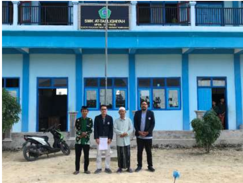
Gambar 1. Lokasi Pengabdian

Pengabdian dilakukan pada SMK PP At-Tablighiyah Batumarmar Pamekasan. SMK ini beralamat di Dsn. Sokon Ponjanan Timur Kecamatan Batumarmar Pamekasan. Sekolah ini dikenal sebagai lembaga pendidikan yang memiliki fokus pada pengembangan keterampilan teknis dan kewirausahaan bagi santrinya. Meskipun terletak di daerah pinggir, SMK PP At-Tablighiyah memiliki semangat tinggi untuk membekali santri dengan keterampilan digital yang dapat membantu mereka bersaing di era modern. Lokasi pengabdian dapat dilihat pada gambar 1.