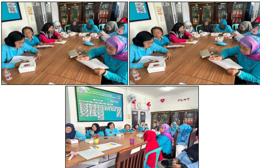
Gambar 4. Pengisian pre-test dan Diskusi Interaktif

Formatted: Font: 10 pt, English (Indonesia)