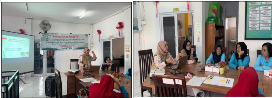
Gambar 3. Edukasi Patuh Minum Obat dan Demo Pillbox

Formatted: Font: 10 pt, English (Indonesia)