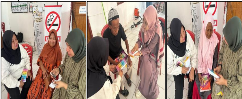
Gambar 5. Demo Edukasi Penggunaan Pillbox ke lansia

Untuk mengevaluasi dan melihat keberhasilan dari pelaksanaan kelas lansia sehat bahagia dan edukasi kepatuhan minum obat, maka dilakukan pre test dan post test yang diberikan kepada komunitas lansia sebelum dan sesudah pemberian materi.