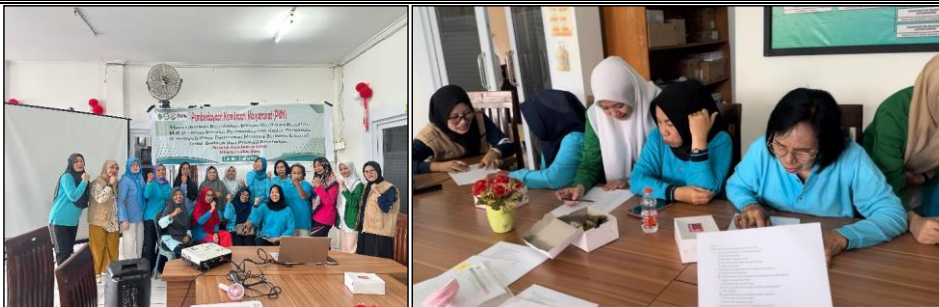
Gambar 5. Foto Bersama dan Pengisian post-test

Untuk mengevaluasi dan melihat keberhasilan dari pelaksanaan kelas lansia sehat bahagia dan edukasi kepatuhan minum obat, maka dilakukan pre test dan post test yang diberikan kepada komunitas lansia sebelum dan sesudah pemberian materi.