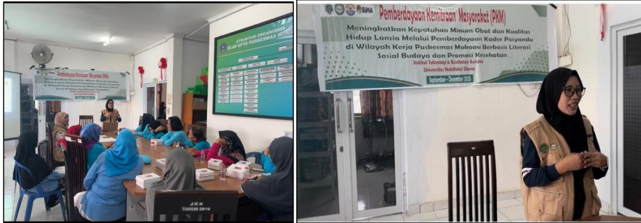
Gambar 2. Pemaparan Materi Kelas Lansia Sehat-Bahagia