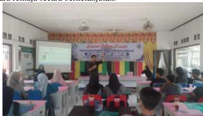
Gambar 4. Pelatihan Publik Spaking

Selain itu kegiatan ini juga berfungsi sebagai sarana penguatan hubungan sosial antara remaja dengan komunitas sekitarnya, sekaligus meningkatkan kesadaran kolektif mengenai pentingnya komunikasi efektif dalam kehidupan sehari-hari. Secara keseluruhan, sosialisasi kepada remaja Desa Suak Indrapuri ini merupakan tahap penting dalam pembelajaran Public Speaking yang menyeluruh, yang tidak hanya fokus pada teori, tetapi juga mengembangkan keterampilan praktis dan sikap positif melalui pengalaman langsung. Dengan demikian, kegiatan ini diharapkan dapat memberikan kontribusi signifikan dalam meningkatkan kompetensi komunikasi para remaja secara berkelanjutan.