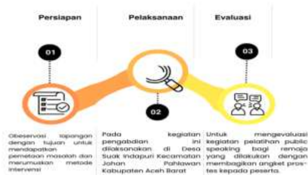
Gambar 2. Tahapan Pelaksanaan

dianalisis menggunakan statistik deskriptif untuk melihat kecenderungan dan perubahan yang terjadi. Pelaksanaan program dilakukan melalui tiga tahapan utama, yaitu tahap persiapan, pelaksanaan, dan evaluasi. Dalam pelaksanaan kegiatan, terdapat tahapan yang meliputi persiapan, pelaksanaan, serta evaluasi guna memastikan efektivitas dan keberlanjutan program.