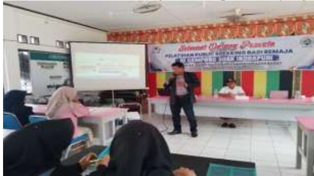
Gambar 3. Sosialisasi Publik Spaking

Speaking , yang berlangsung selama kurang lebih 50 menit. Sosialisasi ini bertujuan untuk memberikan pemahaman awal kepada peserta sebelum mereka mengikuti sesi pelatihan yang lebih aplikatif dan mendalam.