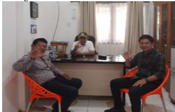
Gambar 1. Observasi Lapangan

Program pengabdian kepada masyarakat ini dilaksanakan di Desa Suak Indrapuri, Kecamatan Johan Pahlawan, Kabupaten Aceh Barat. Lokasi ini dipilih berdasarkan hasil observasi awal yang menunjukkan adanya kebutuhan peningkatan kapasitas keterampilan komunikasi, khususnya dalam hal Public Speaking , di kalangan masyarakat setempat, terutama remaja. Pelaksanaan program di wilayah ini diharapkan dapat memberikan dampak langsung terhadap peningkatan kompetensi individu dalam menyampaikan ide, gagasan, dan pendapat secara efektif di berbagai forum sosial dan komunitas lokal.