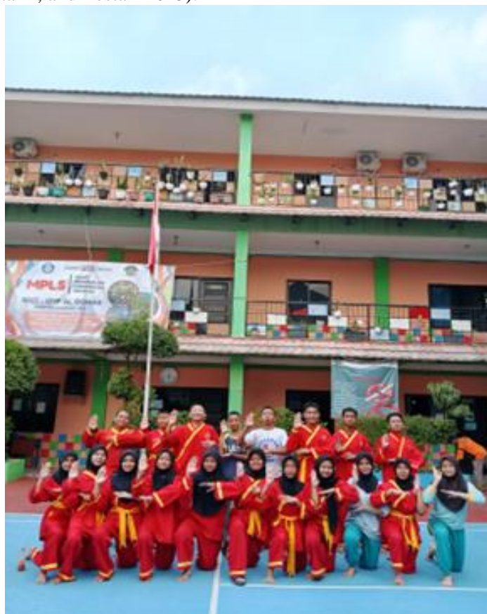
Gambar 1. Kegiatan Peserta Didik

Meskipun telah memiliki reputasi baik dan menjadi salah satu sekolah unggulan di Jakarta Barat, Yayasan Pendidikan Islam Purnama Cendekia masih menghadapi tantangan dalam penerapan teknologi informasi, khususnya dalam sistem administrasi sekolah. Salah satu permasalahan yang dihadapi adalah proses Penerimaan Peserta Didik Baru (PPDB) yang masih dilakukan secara manual. Proses ini memerlukan waktu yang lama, berpotensi terjadi kesalahan input data, serta menyulitkan pengarsipan dan pencarian data calon siswa. (Asidah et al. 2022) Minimnya pelatihan bagi tenaga kependidikan terkait penggunaan teknologi informasi juga menjadi kendala dalam pengelolaan administrasi yang efisien dan terintegrasi. (Nasution, Suteki, and Nasution 2025) Oleh karena itu, diperlukan solusi berupa pelatihan dan implementasi sistem informasi PPDB berbasis website agar kegiatan pendaftaran dapat berjalan lebih efektif, transparan, dan akuntabel. (Simbolon, Utami, and Lestari 2025).