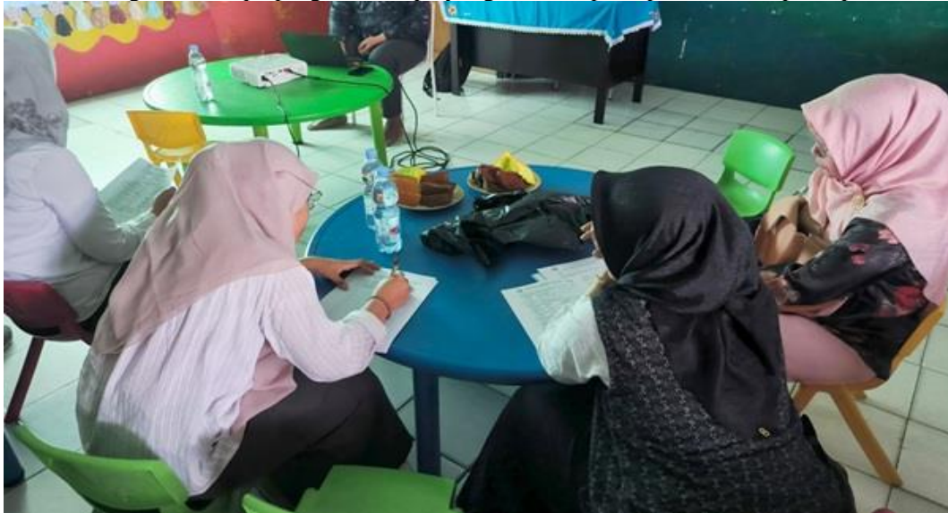
Gambar 5. Peserta Pengisian Kuisioner

and Darmiyanti 2023) yang melaporkan bahwa pelatihan berbasis teknologi mampu meningkatkan efektivitas administrasi sekolah. Namun, kontribusi kegiatan ini lebih unggul karena tidak hanya memberikan pelatihan, tetapi juga mengimplementasikan sistem PPDB online yang langsung digunakan oleh yayasan, berbeda dengan beberapa program serupa yang terbatas pada pelatihan tanpa implementasi sistem.