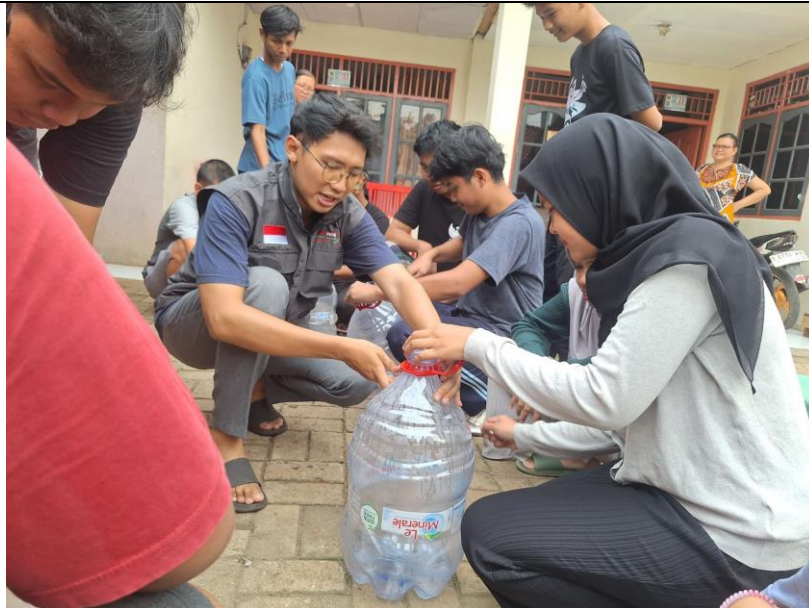
Gambar 4. Remaja warga RT 005/RW 002 saat praktik budidaya lele galon di Kelurahan Sawah Lama.