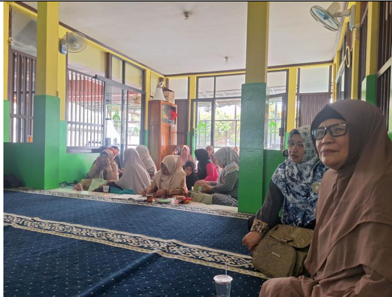
Gambar 3. Kegiatan sosialisasi dan diskusi bersama kelompok ibu-ibu mengenai urban farming.