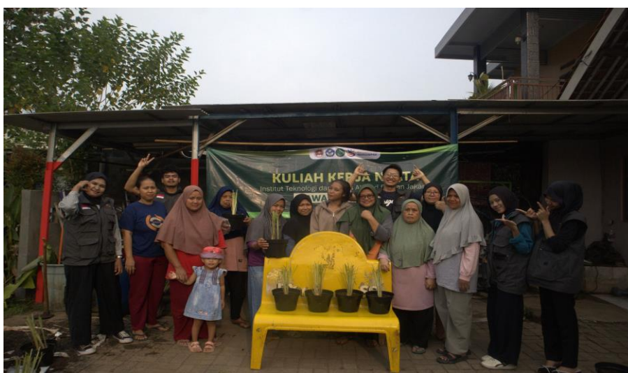
Gambar 6. Foto bersama tim Nawasena Sawala dan warga RT 005/RW 002 Kelurahan Sawah Lama setelah pelaksanaan program pengabdian.