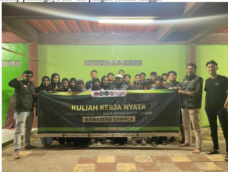
Gambar 2. Foto bersama tim Nawasena Sawala dan peserta remaja setelah kegiatan sosialisasi awal program budidaya lele galon.

Untuk itu, tim Nawasena Sawala mengadakan kegiatan sosialisasi yang melibatkan pengurus RT/RW, remaja, dan kelompok ibu-ibu rumah tangga. Sosialisasi ini digunakan untuk membangun kesadaran dan partisipasi warga terhadap pentingnya inovasi pangan rumah tangga.