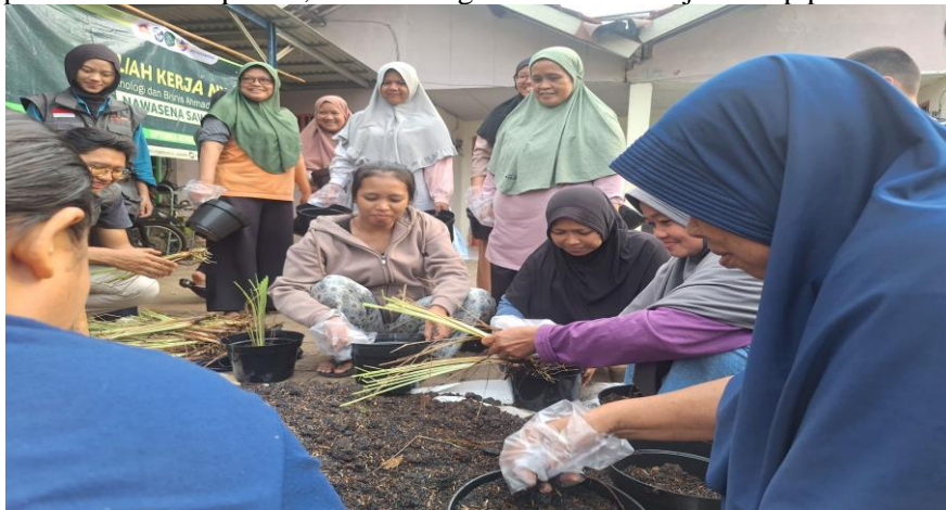
Gambar 5. Partisipasi ibu-ibu RT 005/RW 002 dalam kegiatan urban farming terintegrasi melalui penanaman cabai dan sereh.

(Suryanto et al., 2022) menambahkan bahwa keberhasilan pemberdayaan masyarakat ditentukan oleh pendampingan berkelanjutan dan dukungan teknologi yang sesuai konteks lokal. Pendekatan PAR dalam kegiatan ini memperlihatkan hasil positif, karena warga terlibat aktif sejak tahap perencanaan hingga evaluasi.