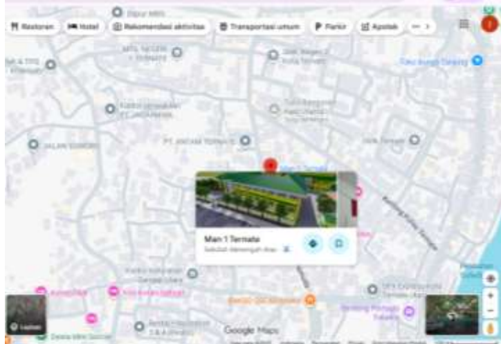
Gambar 1. Lokasi PKM MAN 1 Ternate