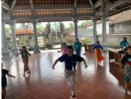
Gambar 1. Lokasi kegiatan pelatihan tari di Balai Banjar Alisbintang, Desa Sulahan