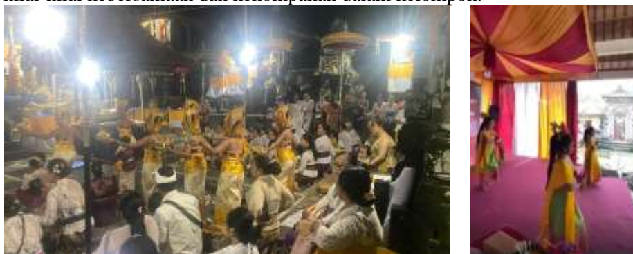
Gambar 3. Pementasan Tari Rejang Dewa dan Tari Puspanjali

Hasil keseluruhan menunjukkan bahwa model pelatihan berbasis masyarakat yang memadukan seni tari tradisional dengan metode PALS mampu memberikan dampak lebih luas dibandingkan program serupa dalam konteks sekolah atau sanggar. Metode PALS memungkinkan peserta untuk terlibat aktif dalam proses belajar dan refleksi sehingga nilai karakter tidak hanya muncul karena pengulangan gerak tari, tetapi juga karena kesadaran diri yang dibangun melalui aktivitas kelompok. Oleh karena itu, pengabdian ini memberikan kontribusi baru dalam bentuk model pembinaan karakter berbasis budaya lokal dan komunitas yang dapat menjadi alternatif strategis dalam penguatan pendidikan karakter pada anak usia sekolah dasar. gerakan, serta menumbuhkan nilai-nilai kebersamaan dan kekompakan dalam kelompok.