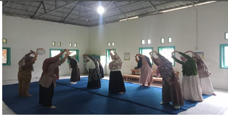
Gambar 1. Melatih gerak tari