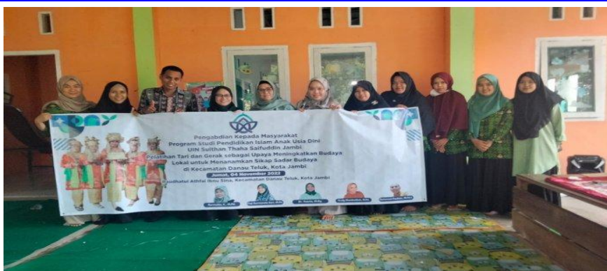
Gambar 2. Kegiatan sosialisasi bersama guru tik

Kegiatan sosialisasi berlangsung dengan lancar. Mulai dari sambutan ketua tim PKM, kepala RA, hingga penyampaian materi. Ringkasan kegiatan sosialisasi dirilis dalam bentuk publikasi di media online lokal Tribun Jambi pada link berikut https://jambi.tribunnews.com/2022/11/08/budaya-daerah-mulai-luntur-dosen-piaud-uin-sts-jambi-turun-ke-lapangan-latih-tenaga-pengajar .