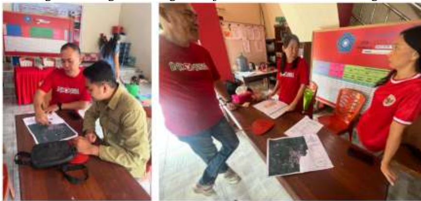
Gambar 3. Diskusi bersama perangkat desa

Rencana tindak lanjut tersebut menjadi komitmen bersama antara perangkat desa dan masyarakat Desa Kapoya untuk memastikan keberlanjutan upaya mitigasi bencana di masa mendatang. Komitmen ini tidak hanya berfokus pada pelaksanaan program saat ini, tetapi juga mencakup pengembangan sistem dan mekanisme yang memungkinkan kegiatan mitigasi berjalan secara berkesinambungan.