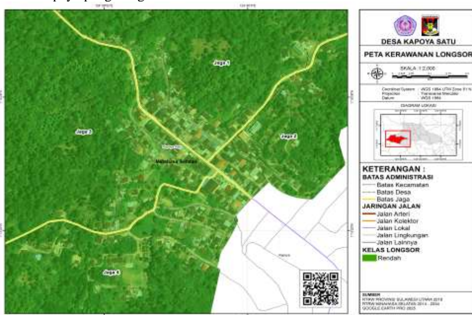
Gambar 4. Peta Rawan Longsor

Meskipun pusat permukiman Desa Kapoya berada pada zona kerawanan rendah, beberapa area dengan lereng curam dan tanah sensitif tetap memerlukan perhatian karena berpotensi mengalami penurunan stabilitas dan longsor lokal. Kondisi ini sejalan dengan temuan penelitian terdahulu, seperti Juhadi et al. (2016) yang menunjukkan bahwa pembangunan pada lereng curam dapat meningkatkan tekanan tanah dan memicu longsor, serta Biomi et al. (2024) yang menekankan pentingnya pengendalian tata guna lahan dan teknik konstruksi yang sesuai karakteristik geoteknik wilayah. Pengabdian masyarakat oleh Ariyani & Endiyono (2020) juga menegaskan perlunya peningkatan kapasitas masyarakat dalam memahami risiko bencana. Berbeda dari studi sebelumnya, pengabdian di Desa Kapoya mengombinasikan analisis teknis dengan pemetaan partisipatif dan edukasi kebencanaan, sehingga memberikan pendekatan yang lebih komprehensif dalam upaya pengurangan risiko.