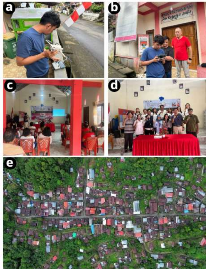
Gambar 2. (a)(b) Drone Mapping, (c)(d) Kegiatan sosialisasi, (e) Hasil Drone Mapping