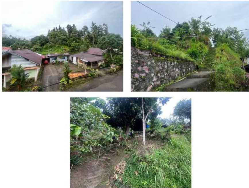
Gambar 1. Foto kontur tanah dan titik longsor di Desa Kapoya

Permasalahan utama yang dihadapi Desa Kapoya berkaitan dengan pola pembangunan yang tidak terkontrol dan belum memperhatikan kondisi geomorfologi wilayah. Banyak rumah dan fasilitas umum dibangun tanpa perencanaan tata ruang yang berbasis pada peta kemiringan lereng atau analisis kestabilan tanah. Menanggapi kondisi tersebut, tim melaksanakan sebuah program “Pelatihan dan Pembuatan Peta Mitigasi Bencana Tanah Longsor sebagai Upaya Mitigasi Bencana di Desa Kapoya, Kabupaten Minahasa Selatan.” Kegiatan ini merupakan bagian dari program Pengabdian kepada Masyarakat (PKM) yang bertujuan untuk meningkatkan kapasitas masyarakat dan pemerintah desa untuk peduli dalam menghadapi ancaman bencana tanah longsor melalui pendekatan edukatif dan partisipatif (Simehate et al, 2023).