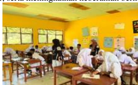
Gambar 3. Diskusi kelas dalam permainan

Setelah sesi debat, kegiatan dilanjutkan dengan tiga jenis interactive games, yaitu Hangman , Word Chain , dan Guess the Word . Ketiganya dirancang untuk memperkuat penguasaan kosakata, melatih kelancaran berpikir, serta meningkatkan keberanian berkomunikasi menggunakan English.