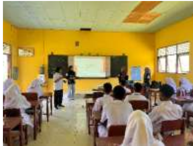
Gambar 1. Suasana pelaksanaan PKM

Permasalahan tersebut menunjukkan perlunya pendekatan yang lebih interaktif, kolaboratif, dan menyenangkan untuk mendorong siswa aktif berbicara dalam Bahasa Inggris, salah satunya melalui debat edukatif dan permainan interaktif.