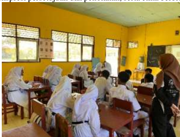
Gambar 2. Pelaksanaan Pengenalan Debat

Sesi debat dilaksanakan dengan mosi “This House Would Ban the Use of AI at School.” Siswa dibagi ke dalam dua tim besar, yaitu Government dan Opposition , masing-masing beranggotakan lima belas orang. Setiap tim mendapat waktu untuk menyiapkan argumen, mengatur peran pembicara, dan menyusun strategi penyampaian. Sebelum debat dimulai, tim dosen memberikan pelatihan singkat tentang struktur debat, ekspresi persetujuan dan penolakan, serta etika berbicara dalam Bahasa Inggris.