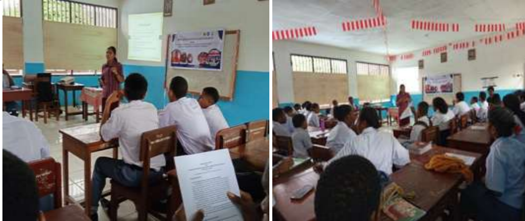
Gambar 1. Penyampaian materi PKM oleh tim pengabdian Sumber: Tim pengabdian, 26 Agustus 2025.

Tahap selanjutnya, praktik dan simulasi teknik wawancara, observasi dan pencatatan data penelitian. Siswa diberi penjelasan mengenai teknik bertanya yang baik, etika berkomunikasi dengan narasumber, serta cara mencatat atau merekam jawaban. Selain itu, teknik observasi lapangan juga diajarkan untuk melatih kepekaan siswa dalam memperhatikan detail lingkungan atau situs sejarah yang diteliti, dan hal-hal yang perlu diobservasi berkaitan dengan materi/topik riset. Praktik simulasi teknik wawancara dan pencatatan data memberikan ruang belajar bagi siswa untuk melakukan praktik simulasi wawancara di kelas dengan peran sebagai peneliti sementara tim pengabdian sebagai narasumber.