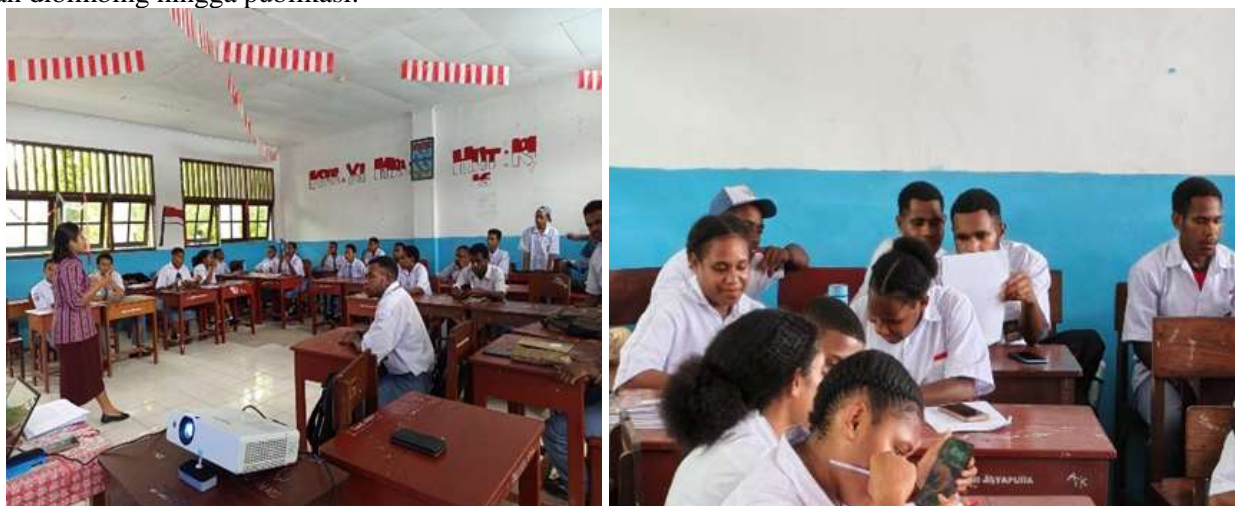
Gambar 2. Praktik simulasi wawancara dan pencatatan data.

Di akhir sesi penyampaian materi dan praktik simulasi, tim pengabdian memberikan tugas membuat riset sejarah dan budaya lokal kepada peserta dan hasilnya akan diserahkan kepada guru mata pelajaran sejarah untuk diteruskan kepada tim pengabdian. Selama membuat tugas riset tersebut, siswa akan didampingi oleh guru mata pelajaran dan tim pengabdian. Selanjutnya hasil riset tersebut akan dinilai kelayakannya untuk diteruskan dan dibimbing hingga publikasi.