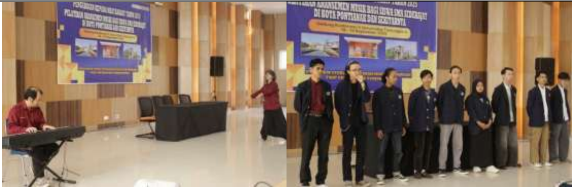
Gambar 2. Pemateri dosen dan tim mentoring mahasiswa