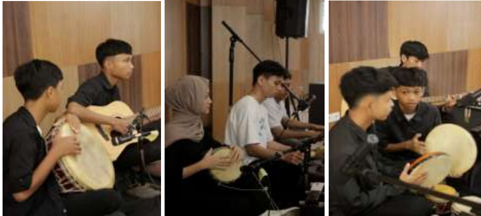
Gambar 4. Pementasan karya oleh para peserta

Hasil pelatihan ini juga menunjukkan bahwa kreativitas dalam musik dapat tumbuh melalui proses berlatih yang konsisten dan berbasis pengalaman (Beetlestone, 2012; Putraningsih et al., 2019). Rekomendasi untuk berikutnya, kegiatan serupa dapat dikembangkan dengan durasi yang lebih panjang atau dilanjutkan dengan pelatihan lanjutan berbasis perangkat lunak musik digital agar peserta didik dapat memproduksi aransemen dengan teknologi yang lebih modern dan instrumen yang lebih luas (Hidayatullah, 2020; Urniežius, 2020). Proses pementasan karya yang dihasilkan dapat dilihat sebagaimana tampak pada gambar 4.