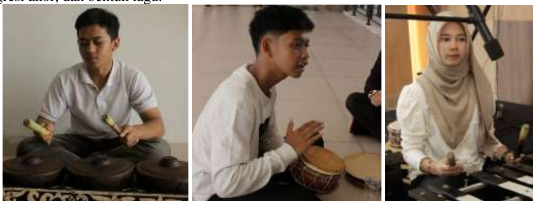
Gambar 3. Proses aransemen dan latihan karya

Pada hari pertama, peserta mendapatkan materi apresiasi karya aransemen dan teori dasar aransemen musik. Narasumber memaparkan berbagai contoh karya aransemen dari lagu populer dan klasik untuk menunjukkan bagaimana variasi harmoni, melodi, dan ritme dapat menghadirkan nuansa yang berbeda dalam sebuah karya. Peserta juga diajak untuk menganalisis struktur lagu serta memahami prinsip dasar harmoni, akor, progresi akor, dan bentuk lagu.