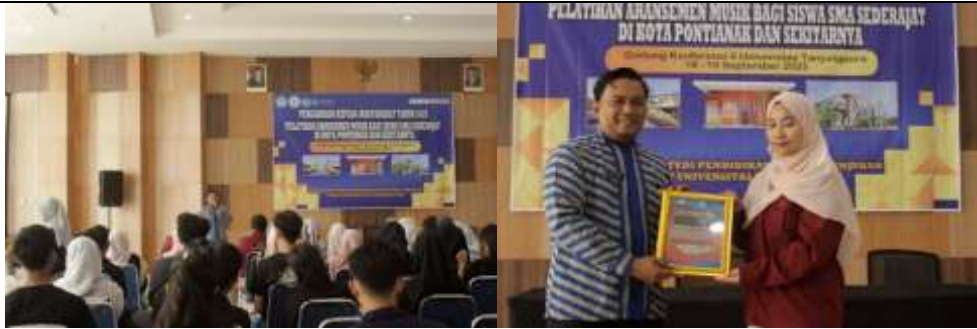
Gambar 1. Pembukaan acara dan pemberian cinderamata kepada Ketua MGMP Seni Budaya