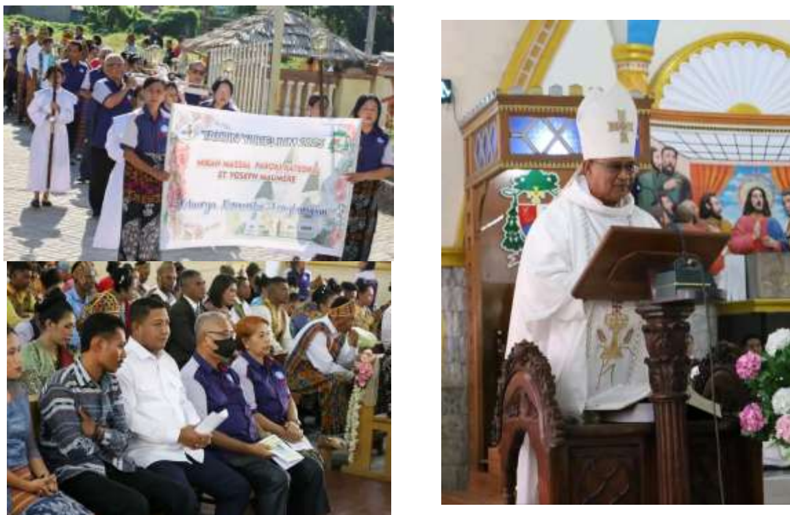
Gambar 3. Upacara Pernikahan Massal Katolik

Hasil dari proses pastoral yang telah dilaksanakan dalam Program Pernikahan Massal Katolik dapat diuraikan sebagai berikut. Ada beberapa penjelasan yang disampaikan para responden berkaitan dengan sumber pengetahuan tentang sakramen perkawinan. Hanya sedikit (16%) responden baru sungguh-sungguh mempelajari tentang nilai-nilai sakramen perkawinan saat mengikuti KPP. Hampir separuh (48%) yang menyadari bahwa orangtua telah menyiapkan bekal jangka panjang untuk membangun hidup berkeluarga, yaitu melalui tradisi masyarakat setempat di Kabupaten Sikka yang telah mengajarkan tentang Sakramen Perkawinan sebagai bentuk ikatan yang syah dalam suatu perkawinan. Para responden ini (48%) mengungkapkan bahwa orangtua yang telah memberi teladan dan menanamkan iman serta ajaran Gereja Katolik yang kuat. Orangtua cenderung mengarahkan anak-anak mereka untuk memilih pasangan yang sama-sama beriman Katolik dengan kepribadian baik supaya perkawinan hanya berlangsung satu kali seumur hidup. Namun dalam wawancara mendalam terungkap dari para responden bahwa disamping pengajaran tentang sakramen perkawinan yang mereka terima dari Kursus Persiapan Perkawinan, teladan orangtua pun sangat berpengaruh dan meneguhkan mereka untuk membangun komitmen perkawinan yang utuh. Sebanyak 86% dari responden menafsirkan nilai-nilai, harapan, dan transformasi yang dialami oleh