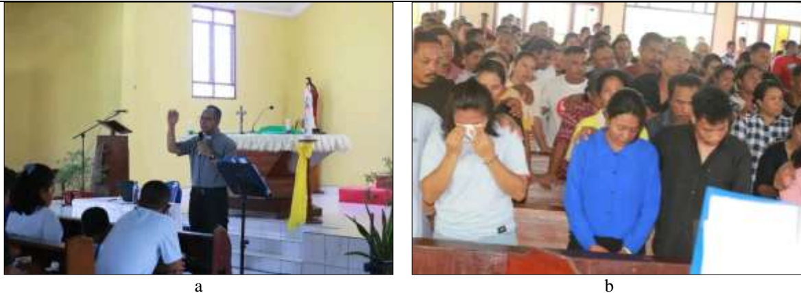
Gambar 2 (a,b). Kursus Persiapan Perkawinan Katolik di Gereja Stasi Wairumbia Maumere