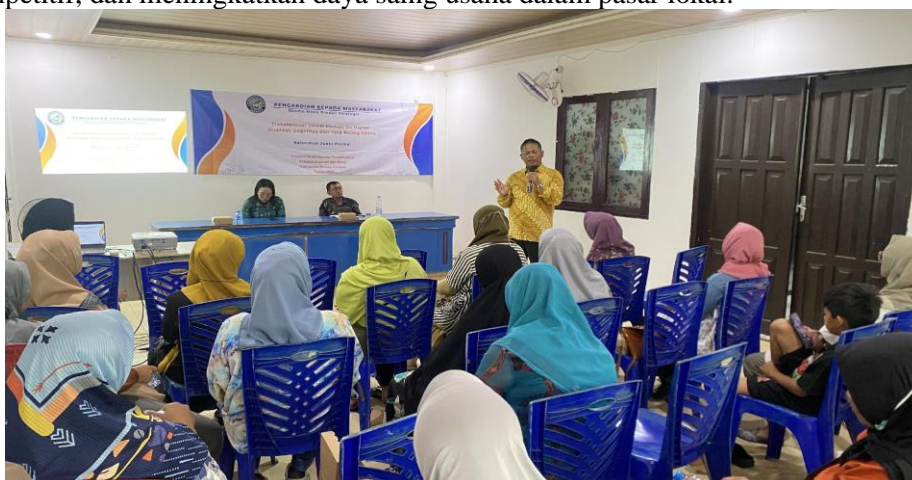
Gambar 3. Pelatihan Google Maps

Kegiatan ini juga dikombinasikan secara hands-on melalui demonstrasi langsung cara membuat profil usaha, mengunggah foto, menulis deskripsi usaha, mengatur jam operasional. Adanya pelatihan ini kemudian meningkatkan pengetahuan teknis, selain itu juga berdampak pada perubahan persepsi pelaku UMKM terhadap pentingnya identitas digital. Sebelum pelatihan, mayoritas mitra belum menyadari bahwa ketiadaan profil lokasi pada Google Maps merupakan hambatan utama bagi usaha mereka untuk ditemukan konsumen, terutama di sektor kuliner yang sangat bergantung pada kunjungan fisik. Setelah pelatihan, peserta menunjukkan peningkatan keyakinan bahwa kehadiran digital dapat memperluas jangkauan usaha, memperkuat posisi kompetitif, dan meningkatkan daya saing usaha dalam pasar lokal.