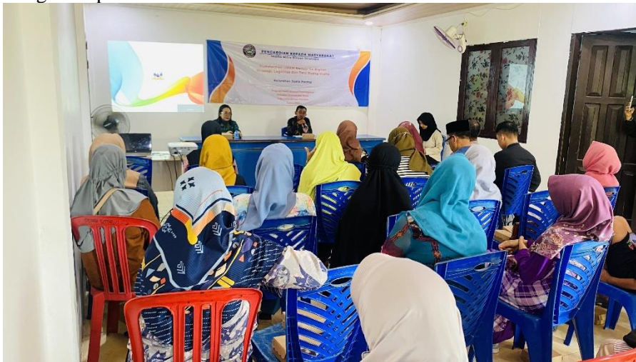
Gambar 2. Pelatihan NIB dan Legalitas Usaha

metode pelatihan berbasis praktik langsung ( experiential training ) efektif dalam meningkatkan literasi legalitas pelaku UMKM.