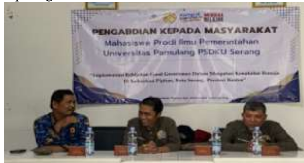
Gambar 2. Kegiatan PKM Dosen

Kader PKK, serta mempersiapkan segala sesuatu yang dibutuhkan untuk menunjang kegiatan PKM pada Sabtu, 19 April 2025, terlihat pada gambar 2.