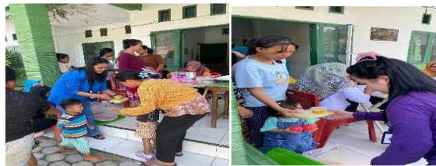
Gambar 3. Pelaksanaan intervensi gizi pada balita

Stunting adalah kondisi gagal tumbuh pada bayi yang belum mencapai usia dua tahun. Keadaan ini disebabkan kekurangan asupan nutrisi dalam jangka waktu yang lama (Hafid, 2016) (Hafid & Nasrul, 2016). Yaitu sejak masih ibunya remaja, janin dalam kandungan hingga bayi berusia 2 tahun. Dampaknya terjadi gangguan pertumbuhan fisik dan perkembangan kognitif sereta memberi dampak pada kesehatan dan kualitas hidup anak sebagai dampak jangka panjang (Zeidler et al., 2022).