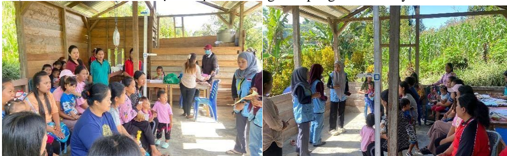
Gambar 1. Pelaksanaan edukasi Pencegahan stunting melalui Intervensi Gizi

Pada sesi ketiga, pemberian edukasi mengenai pencegahan stunting melalui intervensi gizi. Peserta kemudian menyimak materi yang diberikan secara bersama-sama berdasarkan panduan dari materi penyuluhan dan leaflet yang telah diberikan. Sesi terakhir merupakan proses evaluasi berupa post-test , di mana adanya kenaikan nilai rata-rata sebesar 81,25, namun nilai rata-rata pre-test yang hanya 56,5. Setelah itu, dilakukan evaluasi dan penutupan dari kegiatan pengabdian masyarakat.