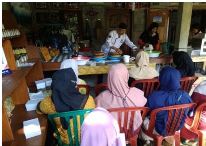
Gambar 4. Sesi Hands On Practice Dalam Pelatihan Cake Decoration

Dengan mengajak langsung para peserta pelatihan dalam praktek menghias kue, maka para peserta didik akan memiliki pengalaman empiris yang positif dalam meningkatkan kualitas pemahaman dan penguasaan keterampilan dari berbagai teknik dan seni cake decoration .