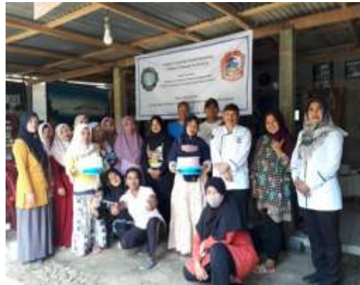
Gambar 1. Para Instruktur Dan Para Peserta Pelatihan