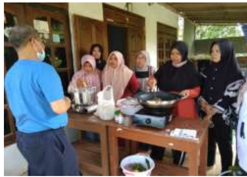
Gambar 7. Sesi Hands On Practice Dalam Pelatihan Cooking