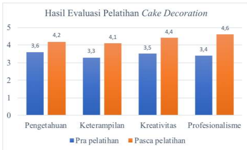
Gambar 5. Chart Skor Hasil Evaluasi Pelatihan Cake Decoration

Evaluasi pelatihan adalah proses sistematis untuk menganalisis program pelatihan guna memastikan bahwa pelatihan tersebut disampaikan secara efektif dan efisien. Evaluasi membantu mengidentifikasi kesenjangan pelatihan dan menemukan peluang untuk meningkatkan program pelatihan. Dengan mengumpulkan umpan balik, instruktur pelatihan sumber daya manusia dapat menilai apakah program pelatihan mampu mencapai hasil yang diinginkan, dan apakah materi dan sumber daya pelatihan yang digunakan selaras dengan atau memenuhi standar yang diinginkan. Evaluasi pelatihan memungkinkan umpan balik komprehensif tentang nilai program pelatihan dan efektivitasnya dalam mencapai tujuan bisnis. Hal ini membantu manajemen untuk lebih memahami dan mengidentifikasi kesenjangan keterampilan untuk menganalisis hasil yang diinginkan dari program pelatihan.. Setelah para peserta pelatihan selesai mempraktekkan berbagai keterampilan cake decoration dalam sesi hands on practice , maka sesi berikutnya adalah sesi evaluasi oleh instruktur bapak Susilo. Evaluasi dilakukan untuk mengkritisi dan mengoreksi berbagai kesalahan dan kekurangan yang terjadi dalam teknik dan seni cake decoration , dan menjadikan tindakan korektif tersebut menjadi media edukatif dalam meningkatkan kualitas pemahaman para peserta pelatihan. Selain itu evaluasi dan asesmen juga dilakukan dengan menggunakan angket yang dibagikan sebelum dan sesudah pelatihan dilakukan.