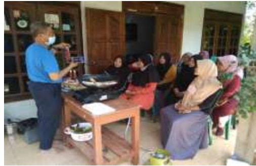
Gambar 6. Sesi Kuliah Materi Pelatihan Cooking