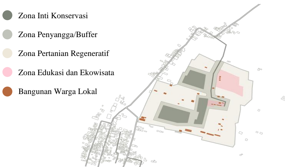
Gambar 4. Masterplan apabila dilakukan proses modifikasi dan adaptasi model CBT terhadap kondisi dan kebutuhan setempat.