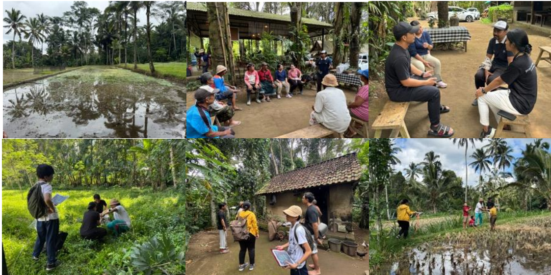
Gambar 2. Foto dokumentasi kegiatan survey lapangan dan FGD

kerangka CBT sebagai dasar perencanaan. Observasi dilakukan untuk mengidentifikasi kondisi ekologis habitat kunang-kunang, tingkat polusi cahaya, penggunaan pestisida, dan dinamika aktivitas sosial masyarakat. Pemetaan partisipatif yang melibatkan petani, pemuda, perangkat desa, dan Rumah Konservasi Kunang-Kunang menghasilkan data geospasial mengenai lokasi habitat sensitif, jalur pertanian, sumber cahaya, serta area potensial untuk edukasi dan ekowisata.