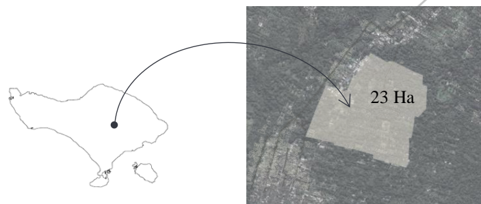
Gambar 1. Peta Lokasi Pengabdian