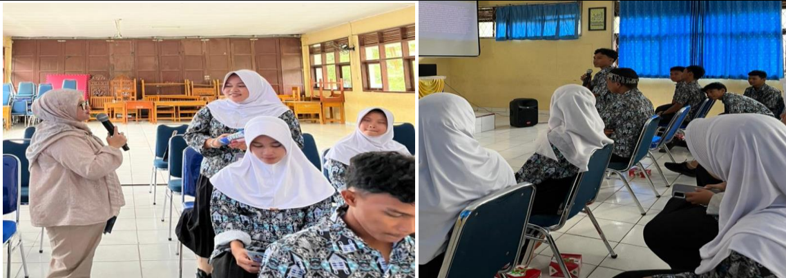
Gambar 2. Pemaparan Materi dan Sesi Tanya Jawab