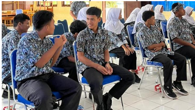
Gambar 1. Siswa sedang berdiskusi mengenai kesulitan dalam pidato menggunakan Bahasa Inggris

Masalah ketiga adalah rendahnya literasi politik siswa. Ketika diminta untuk menyusun pidato bertema politik, sebagian siswa belum memahami konsep dasar seperti demokrasi, kepemimpinan, dan toleransi. Mereka kesulitan menghubungkan topik politik dengan kehidupan sehari-hari, sehingga argumen yang disampaikan cenderung dangkal dan kurang terstruktur. Hal ini menunjukkan bahwa aspek pendidikan kewarganegaraan masih belum terintegrasi secara optimal dalam pembelajaran Bahasa Inggris.