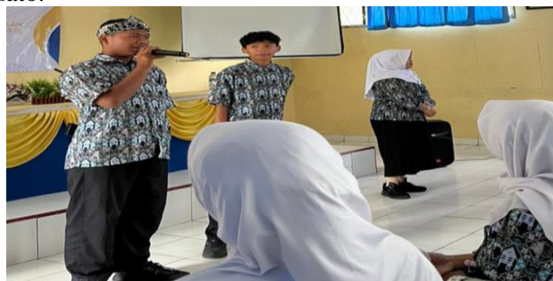
Gambar 3. Siswa melakukan praktek pidato

Setelah setiap kelompok menyusun naskah pidato, salah satu anggota kelompok mewakili mereka dalam membaca pidato.