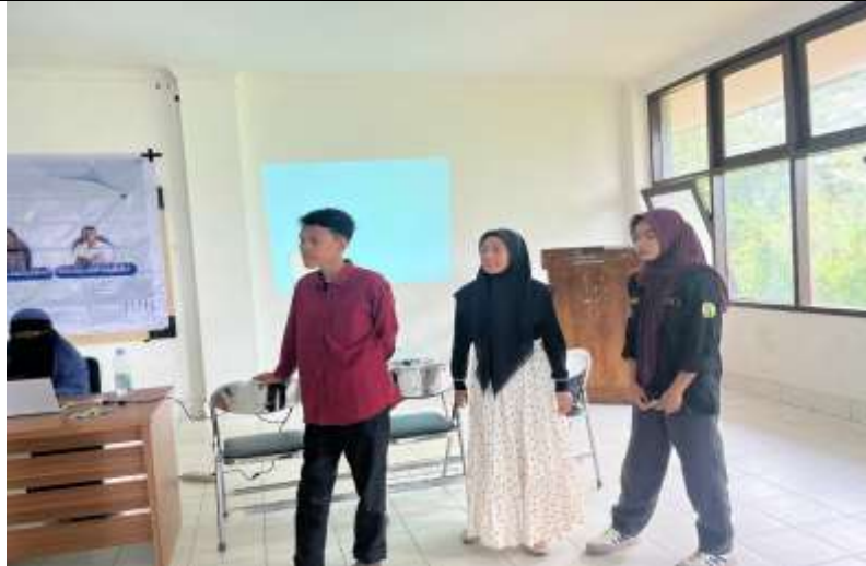
Gambar 2. Mahasiswa diberikan pelatihan mengolah suara, volume dan tempo berbicara

Selain itu, peserta diajak memahami pentingnya menyesuaikan gaya berbicara dengan jenis audiens. Melalui studi kasus dan simulasi, mahasiswa belajar mengenali karakteristik pendengar berdasarkan latar belakang sosial, tingkat pendidikan, dan kebutuhan informasi, agar pesan yang disampaikan relevan dan mudah diterima. Aspek psikologis juga mendapat perhatian khusus, di mana peserta berlatih mengenali dan mengelola sumber rasa cemas sebelum berbicara, seperti ketakutan salah ucap, takut dinilai, atau lupa materi.