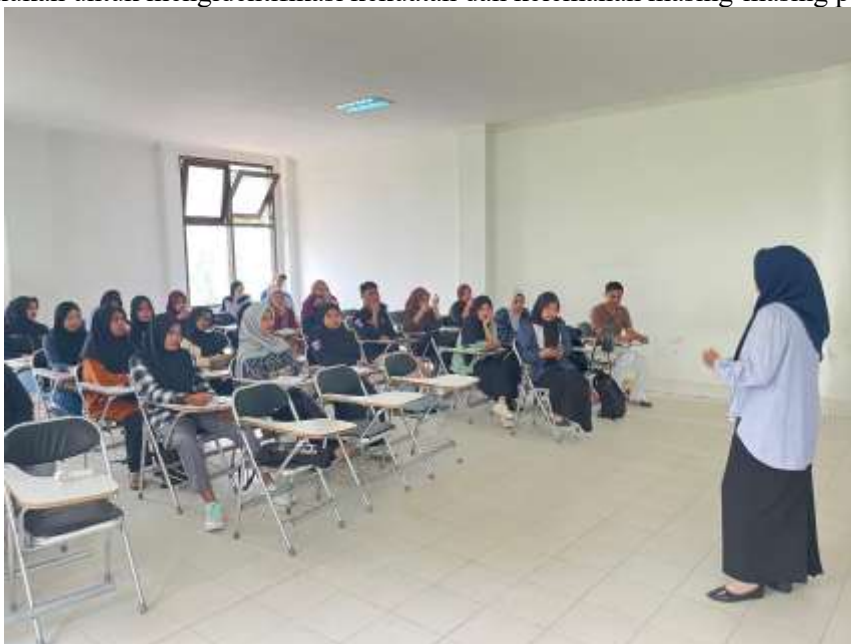
Gambar 4. Pembagian kelompok mahasiswa untuk role playing

Peserta dibagi ke dalam beberapa kelompok kecil agar suasana lebih nyaman dan kondusif. Setelah setiap penampilan, fasilitator memberikan bimbingan langsung dan umpan balik personal, meliputi aspek pengaturan intonasi, pemilihan diksi, alur argumentasi, serta penggunaan gestur dan kontak mata. Diskusi terbuka juga dilakukan untuk mengidentifikasi kekuatan dan kelemahan masing-masing peserta.