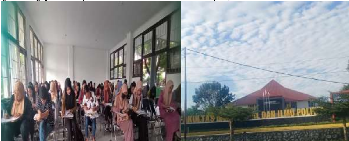
Gambar 1. Lokasi Pelaksanaan Pengabdian

hal kemampuan berbicara di depan publik. Berdasarkan hasil observasi awal dan diskusi bersama dosen pembimbing serta mahasiswa, ditemukan bahwa sebagian besar mahasiswa masih memiliki hambatan dalam mengomunikasikan gagasan secara lisan. Hambatan tersebut muncul baik dalam konteks kegiatan akademik, seperti presentasi kelas dan diskusi ilmiah, maupun dalam kegiatan organisasi dan sosial kemahasiswaan. Gambar 1 adalah salah satu contoh suasana di ruang perkuliahan yang masih pasif saat diskusi berjalan. Mahasiswa cenderung tidak memiliki keberanian untuk tampil atau sekadar mengemukakan ide mereka di depan kelas. Itulah sebabnya kami melaksanakan pelatihan ini untuk mendorong keberanian dan memberikan tips terkait public speaking di lingkungan akademik. Banyak permasalahan yang kami temukan terkait dengan kurangnya keterampilan mahasiswa untuk berbicara di depan publik.