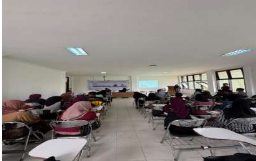
Gambar 5. Pemateri mengajarkan teknik grounding kepada peserta pelatihan

Selain aspek emosional, masalah teknis juga diatasi melalui pelatihan penguasaan panggung, strategi menghadapi audiens pasif, serta penggunaan alat bantu visual yang efektif. Hasilnya, mahasiswa menunjukkan peningkatan nyata dalam kemampuan mengontrol emosi, menjaga konsentrasi, serta mengatur posisi tubuh saat berbicara di depan publik.