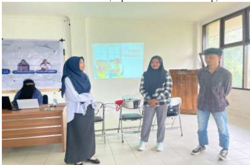
Gambar 3. Mahasiswa diberi tips mengatasi rasa cemas saat berbicara

Selain itu, peserta diajak memahami pentingnya menyesuaikan gaya berbicara dengan jenis audiens. Melalui studi kasus dan simulasi, mahasiswa belajar mengenali karakteristik pendengar berdasarkan latar belakang sosial, tingkat pendidikan, dan kebutuhan informasi, agar pesan yang disampaikan relevan dan mudah diterima. Aspek psikologis juga mendapat perhatian khusus, di mana peserta berlatih mengenali dan mengelola sumber rasa cemas sebelum berbicara, seperti ketakutan salah ucap, takut dinilai, atau lupa materi.