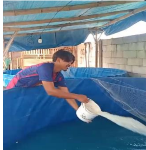
Gambar 5. Pemberian garam

lele. Akbar (2022) mengatakan bahwa pemberian garam dapat menyeimbangkan pH air, membersihkan insang ikan serta mencegah pertumbuhan bakteri dan jamur Saprolegnia yang dapat membunuh ikan. Setelah itu dilakukan pemasangan aersi untuk menambah sirkulasi air dan pengdukan flok.