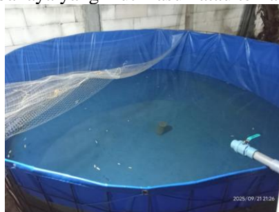
Gambar 4. Pengisian Air Kolam

Kolam yang telah dicuci selanjutnya ditambahkan air surmur setinggi 30 cm kemudian dibiarkan selama 3 hari. Pemberian air ini bertujuan untuk menciptakan lingkungan perairan yang stabil serta untuk penyesuaian kondisi lingkungan air kolam. Fadila et al. (2025) mengatakan bahwa air yang dibiarkan berfungsi untuk menguapkan zat berbahaya yang ikut masuk atau terkandung dalam air.