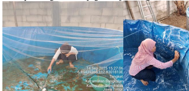
Gambar 3. Pembersihan kerak dan Pembersihan kolam dengan sabun

Pelaksanaan implementasi budidaya sistem bioflok memiliki beberapa tahapan. Tahap pertama dalam budidaya sistem bioflok adalah pembersihan kolam. Kolam yang digunakan adalah kolam jenis terpal dengan ukuran 3 x 1 meter. Pembersihan kolam dilakukan dengan menghilangkan kerak menggunakan sikat terlebih dahulu secara perlahan pada bagian dasar dan dinding kolam, setelah itu dibilas hingga bersih. Kemudian kolam dicuci dengan sabun dan air menggunakan spons. Tujuan pembersihan kolam menggunakan sabun agar terhindar dari kontaminasi mikroorganisme patogen pembawa penyakit dari sisa budidaya sebelumnya. Hal ini sesuai dengan pernyataan Wijayanti & Jannah, (2024) bahwa mencuci menggunakan sabun mampu mengurangi jumlah koloni bakteri sehingga efektif untuk menjaga sanitasi wadah. Selain itu pembersihan terpal dengan sabun juga menjadi langkah awal sterilisasi pada kolam.