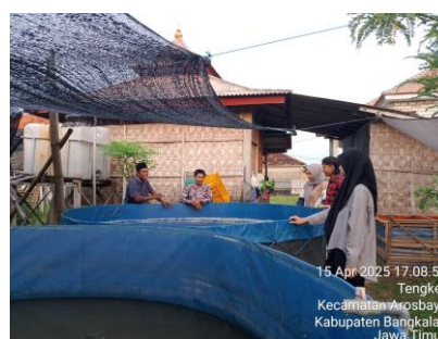
Gambar 2. Tempat Budidaya King Lele Farm