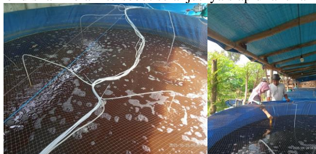
Gambar 6. Air kolam bioflok dan Pengukuran kualitas Air

Jika telah diketahui jumlah probiotik, molase dan airnya selanjutnya dicampur dalam wadah steril dan ditunggu selama 30 menit. Kemudian, biang bioflok ditebar secara merata dan ditambahkan air hingga ketinggian air mencapai 60 cm dan difermentasikan selama 2 hari sebelum ikan lele di tebar. Air yang berwarna cokelat kekuningan menunjukkan tanda bahwa komunitas mikrobial telah berkembang dan siap menjadi pakan alami untuk ikan (Corio et al. , 2018). Selanjutnya pengukuran kualitas air juga dilakukan meter sesuai dengan SNI. Candra et al. (2022) menjelaskan bahwa air kolam akan memiliki butiran yang melayang pada air kolam. Kondisi air kolam tersebut selanjutnya siap dilakukan penebaran benih.