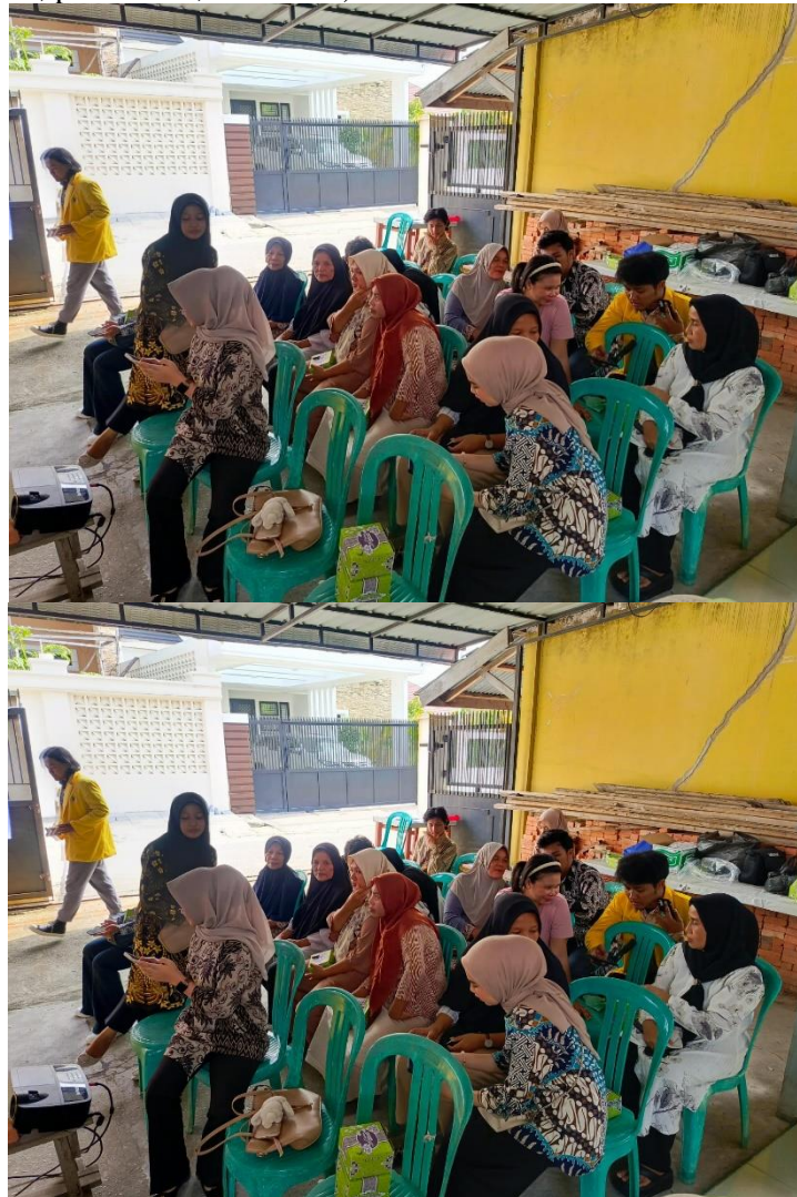
Gambar 3. Sosialisasi pada Karang Taruna dan Masyarakat