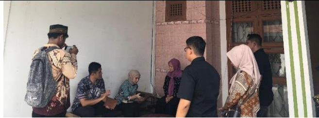
Gambar 1. Survey Lokasi Kegiatan