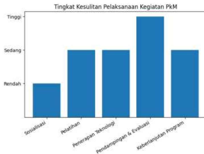
Gambar 2. Grafik tingkat kesulitan pengembangan