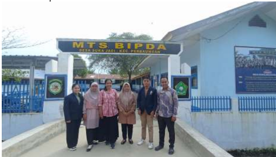
Gambar 1. Lokasi Pengabdian PKM