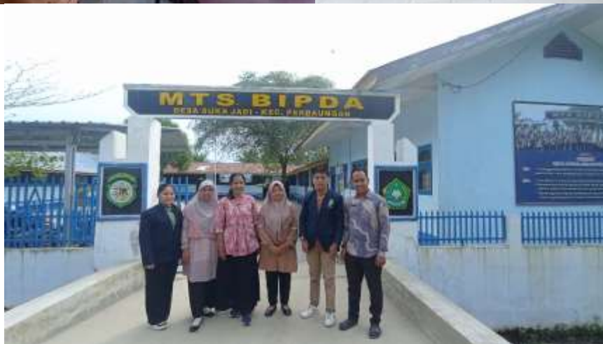
Gambar 3. Kegiatan Pengabdian Masyarakat