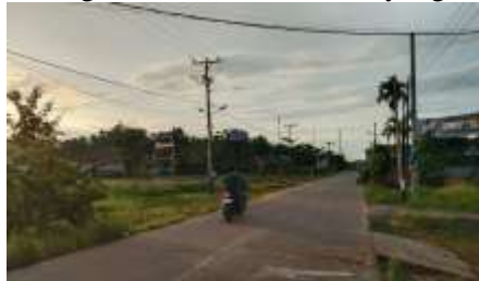
Gambar 1. Lokasi Kegiatan KUKERTA

yang memerlukan intervensi serius. Pertama, rendahnya literasi digital membuat masyarakat kesulitan memverifikasi informasi di platform daring, sehingga rentan terhadap hoaks, ujaran kebencian, dan narasi radikal yang mengancam harmoni sosial. Kedua, minimnya program edukasi moderasi berbasis komunitas menyebabkan pemahaman toleransi dan kerukunan bersifat pasif, tanpa partisipasi aktif lintas generasi untuk menangkai ekstremisme maya. Ketiga, terbatasnya ruang interaksi sosial inklusif membuat masyarakat cenderung berkumpul homogen, memperkuat stereotip dan sikap eksklusif terutama di kalangan muda. Keempat, website kelurahan belum optimal sebagai platform edukatif untuk dakwah moderat dan pemberdayaan digital, hilangkan peluang menyebarkan konten positif. Program KUKERTA Kelurahan Teluk Nilau menjawab tantangan ini melalui pendekatan partisipatif yang mengintegrasikan olahraga, edukasi, dan literasi digital guna membangun ekosistem moderat yang berkelanjutan.