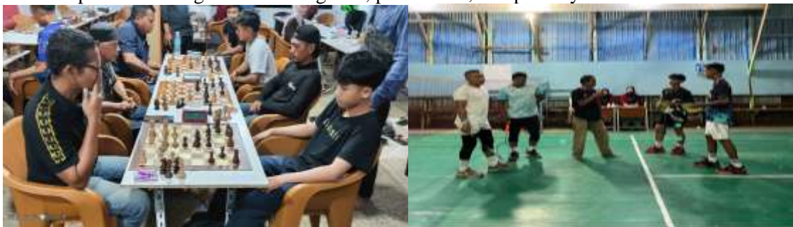
Gambar 2. Turnamen Catur dan Turnamen Badminton

Pelaksanaan turnamen catur dan turnamen badminton yang diselenggarakan oleh mahasiswa KUKERTA di Kelurahan Teluk Nilau menunjukkan bahwa olahraga dapat menjadi media efektif dalam menanamkan nilai-nilai moderasi beragama dan karakter sosial di tengah masyarakat. Catur sebagai olahraga berbasis strategi menuntut pemain untuk berpikir rasional, mengendalikan emosi, serta menghargai keputusan dan langkah lawan. Lebih lanjut, turnamen badminton tidak hanya berorientasi pada pencapaian prestasi dan kebugaran jasmani, tetapi juga dapat menjadi sarana penanaman nilai-nilai moderasi melalui nilai disiplin, kerjasama, sportivitas dalam menerima keputusan wasit, serta sikap saling menghargai antarindividu. Selama turnamen berlangsung, peserta menunjukkan sikap sportivitas dengan menerima hasil pertandingan secara terbuka, mematuhi aturan permainan, serta menjaga sikap saling menghormati antarpemain tanpa memandang latar belakang usia, pendidikan, maupun keyakinan.