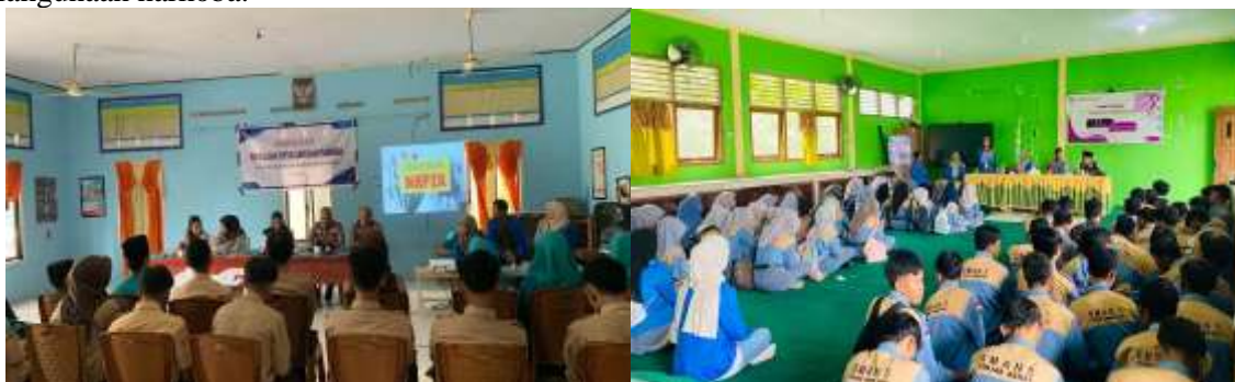
Gambar 4. Sosialisasi Pencegahan Penyalahgunaan Narkoba dan Sosialisasi Pencegahan Pernikahan Dini

Pendekatan edukatif yang menggabungkan nilai-nilai moderasi beragama dengan permasalahan sosial yang nyata terbukti memberikan dampak positif dalam berbagai kegiatan pengabdian masyarakat. Hasil penelitian (Pamessangi et al., 2024) menunjukkan bahwa upaya edukasi pencegahan pernikahan dini melalui pendidikan agama Islam mampu meningkatkan pemahaman peserta mengenai kesiapan dalam membangun kehidupan pernikahan. Selain itu, temuan (Ferdilla et al., 2023) juga memperlihatkan bahwa pemahaman nilai moderasi beragama berperan efektif dalam mencegah berbagai bentuk perilaku menyimpang, termasuk penyalahgunaan narkoba.