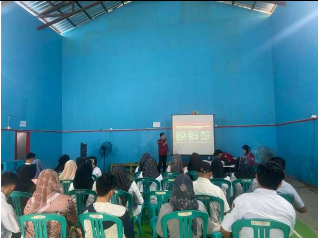
Gambar 2. Materi Corporate Social Responsibility (CSR) & Sinergi terhadap Masyarakat

Pelaksanaan Corporate Social Responsibility (CSR) yang efektif menuntut adanya sinergi dan kemitraan yang adil serta transparan antara perusahaan, pemerintah, dan Masyarakat. Keberhasilan Corporate Social Responsibility (CSR) tidak hanya ditentukan oleh sebuah komitmen dari Perusahaan, tetapi adanya keterlibatan aktif Masyarakat sebagai subjek utama serta adanya dukungan pemerintah sebagai regulator dan fasilitator. Transparansi Corporate Social Responsibility (CSR) khususnya dalam perencanaan, penggunaan sumber daya, dan pelaporan hasil menjadi factor penting dalam membangun kepercayaan public dan memastikan bahwa manfaat tersebut dapat dirasakan secara merata. Temuan pengabdian menunjukkan bahwa Masyarakat memiliki aspirasi kuat untuk dapat terlibat langsung dalam perencanaan dan pelaksanaan program Corporate Social Responsibility (CSR), sehingga kolaborasi multipihak yang seimbang berpotensi menjadikan Corporate Social Responsibility (CSR) sebagai instrument Pembangunan desa yang inklusif dan berkelanjutan.