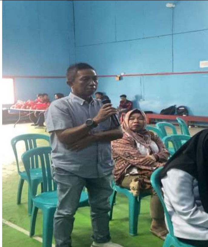
Gambar 3. Tanya-jawab mengenai CSR sebagai pendorong UMKM Lokal