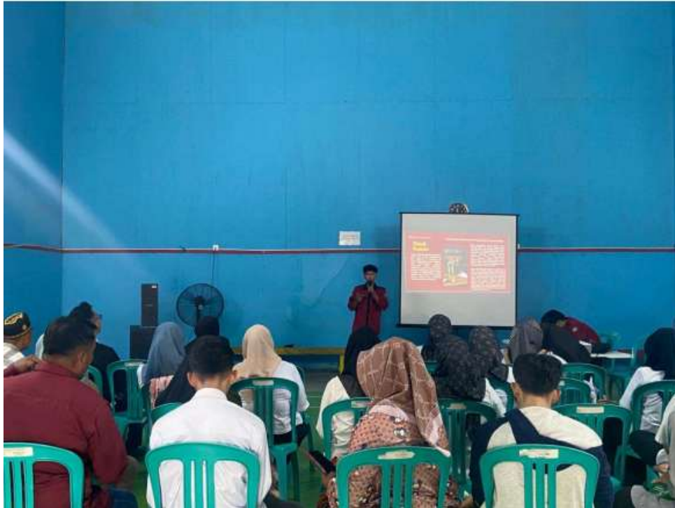
Gambar 2. penyampaian materi Tripple Bottom Line

arah, kegiatan ini menunjukkan hasil yang baik dalam peningkatan pemahaman, namun masih memerlukan pendampingan yang berlanjut agar perubahan pengetahuan dapat bertransformasi menjadi perubahan keterampilan dan praktik nyata. Selain itu, perubahan pemahaman Masyarakat atau peserta tercermin dari aspirasi mereka agar terlibat di perencanaan dan pelaksanaan program Corporate Social Responsibility (CSR). Masyarakat tidak lagi memosisikan diri sebagai penerima manfaat pasif, melainkan sebagai mitra strategis Perusahaan dan pemerintah. Sehingga kegiatan penyuluhan ini telah berkontribusi pada peningkatan kapasitas sosial Masyarakat, yang merupakan prasyarat penting bagi Pembangunan desa berkelanjutan.