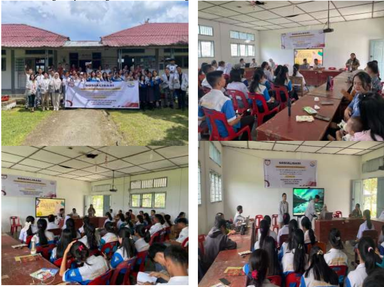
Gambar 2. Foto Kegiatan Peaksanaan

literasi finansial berbasis teknologi ke dalam mata pelajaran kewirausahaan atau ekonomi kreatif untuk memperkuat kompetensi siswa secara berkelanjutan. Melalui pengembangan tersebut, diharapkan siswa mampu menerapkan pencatatan keuangan secara konsisten dan memiliki bekal literasi finansial yang lebih baik dalam menghadapi tantangan ekonomi di era digital.