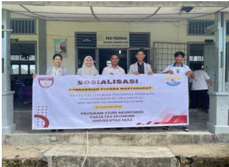
Gambar 1. Pelaksanaan Kegiatan

Permasalahan-permasalahan inilah yang melatarbelakangi pelaksanaan kegiatan Pengabdian kepada Masyarakat berupa pelatihan literasi finansial berbasis spreadsheet di SMK Negeri 1 Gunungsitoli Utara, sebagai upaya meningkatkan kemampuan siswa dalam mengelola keuangan secara mandiri, rasional, dan berbasis teknologi.