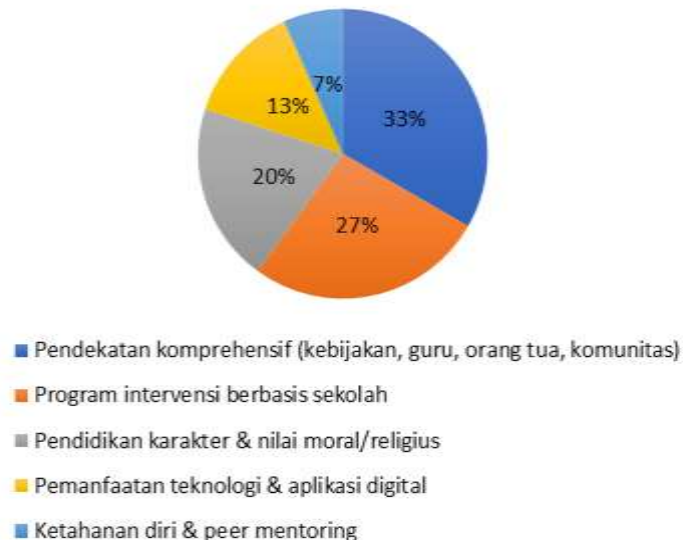
Gambar 2. Diagram Pie Strategi Efektif Pencegahan Bullying (Sumber 15 artikel relevan)

Hasil kegiatan menunjukkan bahwa permasalahan utama mitra bukan hanya pada tingginya potensi bullying, tetapi pada belum adanya sistem pencegahan yang terstruktur. Sebelum kegiatan, pendekatan sekolah cenderung reaktif, berorientasi pada penyelesaian kasus individual tanpa kerangka kebijakan dan program preventif yang jelas. Kondisi ini mencerminkan kesenjangan antara kondisi ideal sekolah aman dan praktik manajerial yang masih parsial.