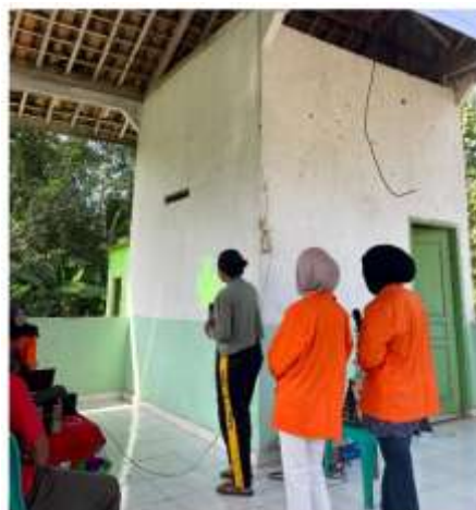
Gambar 3. Kegiatan Pemaparan Materi dan Praktik Uji Coba Pembuatan Konten Digital