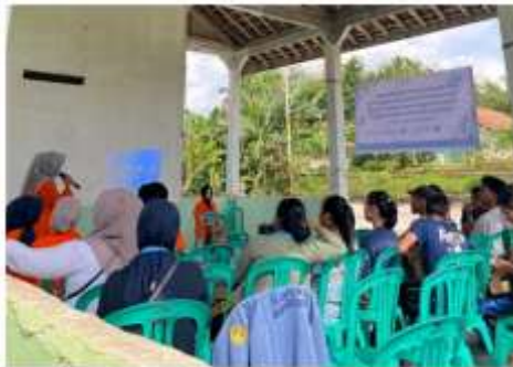
Gambar 2. Kegiatan Sosialisasi dan Pemaparan Materi Komunikasi Digital kepada Anggota Karang Taruna