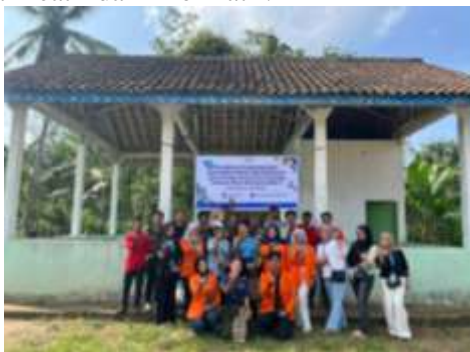
Gambar 1. Dokumentasi Kegiatan Pengabdian di Dusun Margo Makmur, Desa MartaJaya Blok F

Berdasarkan permasalahan tersebut, diperlukan kegiatan sosialisasi dan pelatihan komunikasi digital yang bertujuan untuk meningkatkan pemahaman serta keterampilan anggota Karang Taruna dalam memanfaatkan media sosial secara kreatif dan informatif.