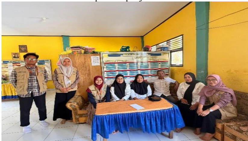
Gambar 1. Koordinasi dengan Kepala Sekolah dan Guru SDN 1 Palarahi

Melalui kegiatan ini diharapkan siswa dapat memahami pentingnya menyisihkan sebagian uang saku, mengenal konsep perencanaan keuangan sederhana, serta mulai membangun kebiasaan menabung sebagai bagian dari pembentukan karakter dan kecakapan hidup sejak usia dini.