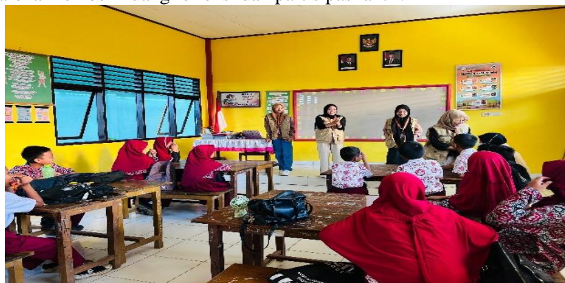
Gambar 2. Penyuluhan Partisipatif Peningkatan Keterlibatan Siswa dalam Diskusi

Selama sesi penyuluhan partisipatif, terjadi peningkatan keterlibatan siswa dalam diskusi. Pendekatan dialogis memungkinkan siswa merefleksikan pengalaman mereka sendiri dalam menggunakan uang saku. Respons verbal siswa menunjukkan adanya pergeseran perspektif, dari orientasi konsumtif menuju pemikiran perencanaan sederhana. Perubahan ini sejalan dengan temuan Kafabih (2020) bahwa diskusi interaktif dan simulasi konkret efektif dalam meningkatkan kesadaran siswa untuk menyisihkan uang saku. Keterlibatan aktif siswa juga mendukung pandangan Laila et al. (2019) bahwa pendekatan partisipatif lebih efektif dibandingkan metode satu arah karena memberi ruang refleksi dan partisipasi aktif.