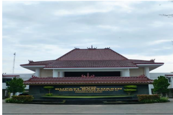
Gambar 1 Gedung Pemkab Banyuwasin

pukul 08.00-16.00 WIB. Para pegawai juga hanya bekerja lima hari dalam satu minggu dimana mereka bekerja hanya pada hari Senin-Jumat untuk hari Sabtu dan Minggu mereka libur kerja.