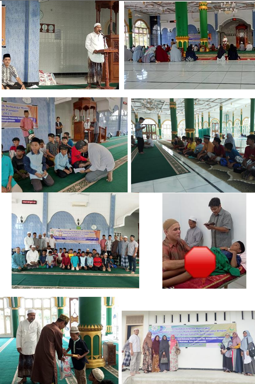
Gambar 2. Dokumentasi kegiatan Khitan massal di Masjid Babul Huda, Lhokseumawe