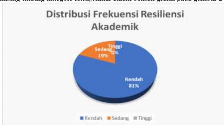
Gambar 1. Diagram Resiliensi Akademik

Berdasarkan data yang telah disajikan di atas, dari 73 siswa tidak ada siswa yang memiliki resiliensi akademik dalam kategori tinggi dengan persentase sebesar 0%, 14 siswa memiliki resiliensi akademik dalam kategori sedang dengan persentase sebesar 19%, dan 59 siswa memiliki tingkat resiliensi akademik dalam kategori rendah dengan persentase sebesar 81%. Dari hasil yang telah diperoleh tersebut dapat disimpulkan bahwa resiliensi akademik pada siswa kelas VIII di MTS Nurul Anwar Kota Bekasi termasuk dalam kategori rendah. Data pada masing-masing kategori ditunjukkan dalam bentuk grafik pada gambar 2 dibawah ini: