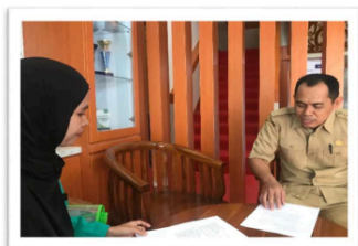
Gambar 1. Wawancara dengan Koordinator P5

Berdasarkan hasil wawancara yang dilakukan peneliti di SMAN 3 Palangka Raya dapat diketahui berjalan melalui beberapa tahap yang terkoordinasi antara koordinator P5, guru Pendidikan Agama Islam (PAI), dan para siswa. Berdasarkan hasil wawancara dengan koordinator P5, pelaksanaan proyek ini sudah berjalan selama dua tahun dengan tingkat partisipasi siswa yang cukup tinggi. Hal ini terlihat dari pernyataan “anak-anak antusias karena setelah mempelajari tentang P5 bullying ini sudah mulai berkurang dan pada saat penyampaian materi berjalan lancar.” (Koordinator P5). Tahap awal pelaksanaan dimulai dari proses perencanaan. Pada tahap ini, meskipun sempat menghadapi kendala karena keterbatasan pengalaman, tim P5 berhasil mengatasi hal tersebut melalui pembelajaran mandiri, studi banding dengan sekolah lain, serta mengikuti berbagai workshop. Hal ini sesuai dengan temuan: “Perencanaan di awal kami mengalami kesulitan... tetapi kami belajar dari sekolah lain dan workshop, sehingga kami bisa melaksanakan P5 sampai tahun ini.” (Koordinator P5).