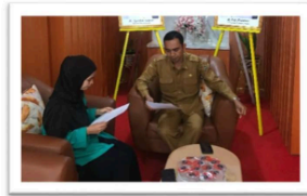
Gambar 2. Wawancara dengan Guru PAI

poster, drama, hingga kampanye anti-cyber bullying di media sosial. Hasil wawancara dengan siswa I mengungkapkan bahwa mereka terlibat dalam “mengerjakan LKPD, menonton video, membuat drama cyber