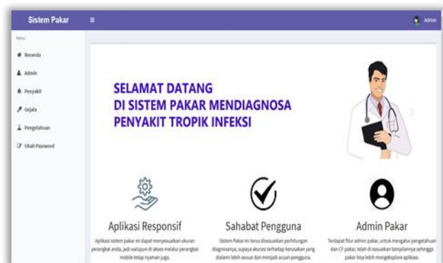
Gambar 3. Tampilan Form Beranda