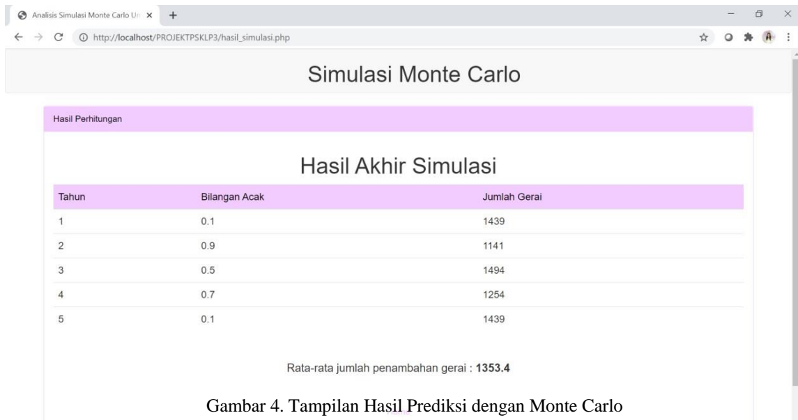
Gambar 4. Tampilan Hasil Prediksi dengan Monte Carlo

Setelah itu akan muncul hasil perhitungan oleh Monte Carlo dalam memprediksi pertambahan jumlah gerai Alfamart di Indonesia dalam waktu 5 tahun kedepan di hitung sejak tahun data tahun terakhir jumlah gerai didapatkan.