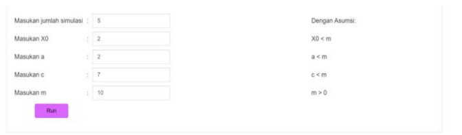
Gambar 3. Tampilan Proses Prediksi

Masukkan jumlah simulasi yang dibutuhkan, dan nilai-nilai yang dibutuhkan untuk membangkitkan bilangan acak. Dalam hal ini jumlah simulasi yang di input adalah 5 karena tujuan penulis hendak memprediksi data untuk lima tahun kedepan dari data terakhir yang di dapatkan. Setelah semua terisi lalu tekan "Run".