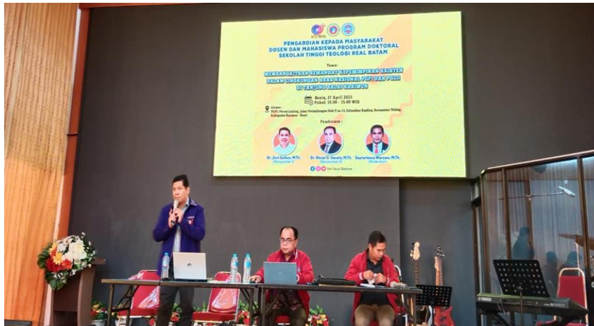
Gambar 2: Pemateri sedang menyampaikan materi PkM kepada para peserta di Lingkungan Aras Nasional PGPI dan PGLII di Tanjung Balai Karimun

KS : Kurang Setuju STJ : Sangat Tidak Setuju