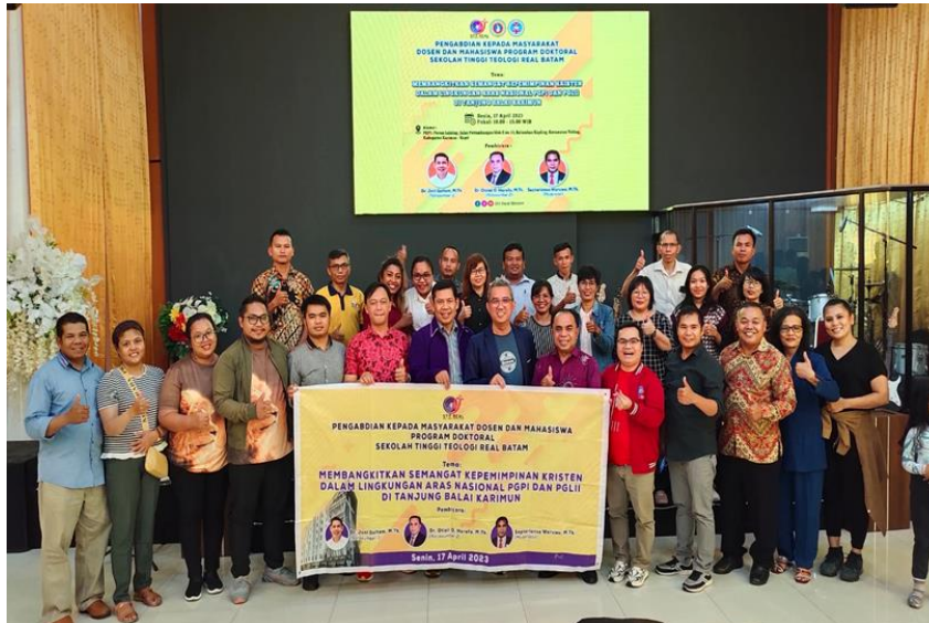
Gambar 1: Foto Bersama Para Panitia PkM Prodi Doktoral STT Real Batam dengan Para Peserta Kegiatan PkM dari Aras Nasional PGPI dan PGLII di Tanjung Balai Karimun

Ada beberapa alasan mengapa pelatihan ini dilakukan, yaitu: Pertama, Adanya dilema jemaat dan pelayan Tuhan mengenai kepemimpinan Kristen, di mana seharusnya pemimpin gereja harus memiliki semangat kepemimpinan Kristen yang berbeda dengan kepemimpinan dunia tawarkan. Kedua, sangat penting memberikan paradigma kepada jemaat dan pelayan Tuhan dalam menjalankan kepemimpinan Kristen yang seturut dengan kebenaran Alkitabiah, sehingga dapat memberikan keteladanan dalam memimpin setiap kebutuhan jemaat. Ketiga, melalui pelatihan ini, para jemaat dan pelayan Tuhan diharapkan memiliki semangat kepemimpinan Kristen. Program ini berlangsung selama dua bulan yang mencakup persiapan, pelaksanaan, dan evaluasi.