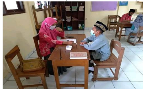
Gambar 2. Pembelajaran di era andemi covid 19