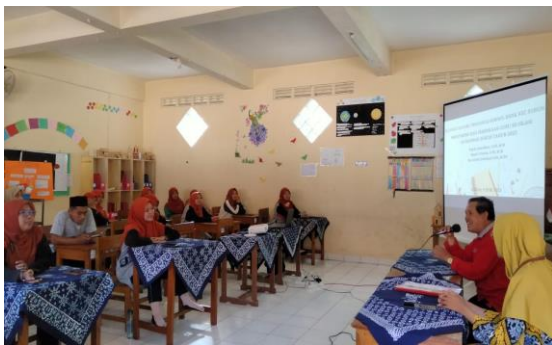
Gambar 3. Pembinaan guru oleh kepala sekolah dan pengawas korwil

Selama masa peralihan dari penyelenggaraan pembelajaran di era pandemi menuju era post pandemi ini, guru PAI menemukan sedikit kendala dalam penyesuaian administrasi pembelajaran era pandemi dan era new normal . Untuk itu, kepala sekolah mengungkapkan bahwa upaya supervisi dilakukan dengan: “pengaktifan kegiatan kelompok kerja rombongan belajar atau guru mapel untuk penyusunan perangkat pembelajaran di tingkat rombel maupun guru mapel, dan menginstruksikan guru-guru untuk selalu berpartisipasi aktif dalam kegiatan KKG di lingkungan kec Suruh, serta mengadakan supervisi di kelas dengan mengkomunikasikan apa yang ingin dilakukan guru dalam pembelajaran di kelas dan sedapat mungkin membantu mencari solusi untuk kesulitan yang ditemui guru.” (Wawancara dengan kepala SD Islam Ar-Rahmah, 21 November 2022).