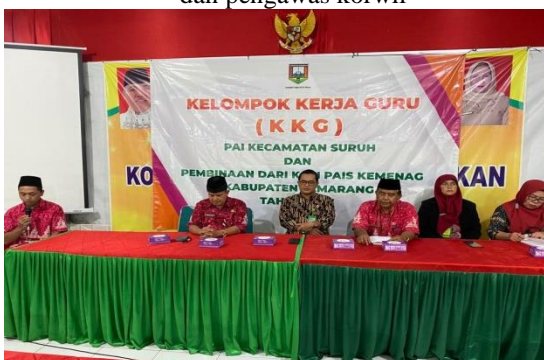
Gambar 5. Delegasi KKG PAI kec. Suruh