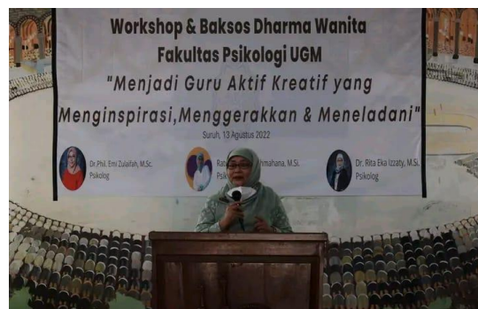
Gambar 6. Kegiatan workshop

Pada supervisi non-direktif ini, kepala sekolah melakukan upaya memelihara dan atau mengembangkan profesionalisme guru dengan meningkatkan intensitas pendelegasian ke forum diskusi, training/ pelatihan, diklat, workshop dan lain sebagainya. Hal ini sesuai dengan ungkapan kepala sekolah berikut: