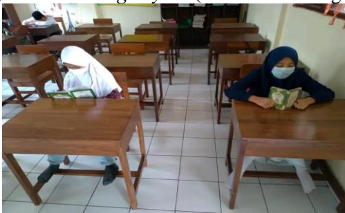
Gambar 1. Pembelajaran di era andemi covid 19

Tanpa disadari, kinerja guru selama pandemi mengalami sedikit penurunan, sebagaimana diungkapkan oleh kepala sekolah: “Ya relatif mengalami penurunan baik disengaja atau pun tidak. Misalnya karena hambatan waktu KBM yang sangat berkurang di masa pandemi, pembatasan kegiatan masyarakat juga sangat membatasi kegiatan pendidikan, intensitas bertemu dg siswa yg relatif sedikit, sulitnya pemantauan kegiatan siswa, dan lain sebagainya.” (Wawancara dengan kepala SD Islam Ar-Rahmah, 21 November 2022).