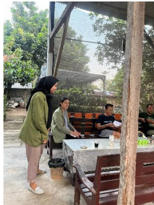
Gambar 4. wawancara dan koordinasi dengan pelaku UMKM

Pada tahap proses perencanaan ini, sejumlah pelaku UMKM dan aparat desa di Kelurahan Tanjungsari diamati dan diwawancarai secara langsung. Hal ini dilakukan untuk mempelajari lebih lanjut tentang karakteristik lingkungan secara keseluruhan dan isu-isu utama yang dihadapi para pelaku UMKM dan untuk memberikan gambaran umum tentang lingkungan tersebut. Persiapan dilakukan dengan mengumpulkan materi. Materi yang dikumpulkan meliputi elemen-elemen yang mempengaruhi efektifitas kegiatan sosialisasi yang bertujuan untuk memberikan informasi kepada pelaku UMKM tentang dasar-dasar pembukuan dan aspek-aspek apa saja yang mempengaruhi kegiatan pendampingan agar lebih efektif.