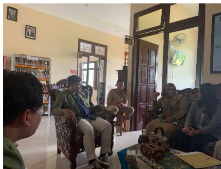
Gambar 5. Koordinasi bersama anggota Kelurahan Tanjungsari