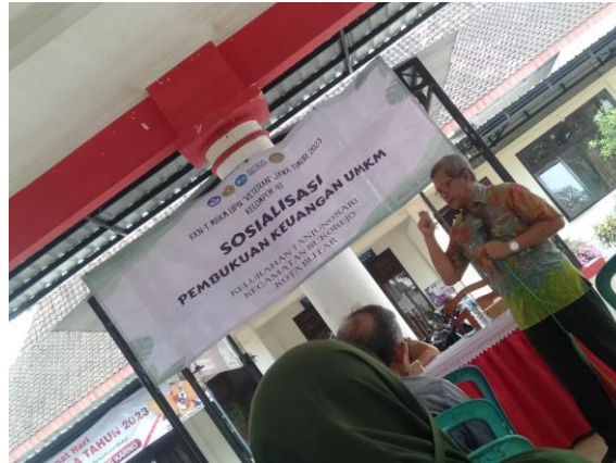
Gambar 6. Tahap pelaksanaan penyampaian materi

diharapkan memahami cara melakukan pencatatan secara manual dengan benar. Selain itu, diharapkan peserta juga memiliki pemahaman yang tepat tentang perbedaan antara pembukuan dan sistem akuntansi.