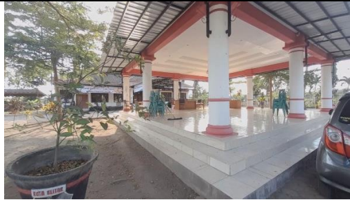
Gambar 2. Tempat dilakukannya kegiatan sosialisasi