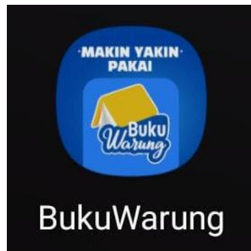
Gambar 3. Aplikasi Buku Warung

Aplikasi yang disosialisasikan untuk Bila Catering yaitu Aplikasi BukuWarung. Aplikasi ini bisa di terapkan di handphone, dan install aplikasinya juga tidak terlalu rumit digunakan. Dimana di dalam aplikasi buku warung ini terdapat banyak icon-icon yang diperlukan oleh UMKM, serta mudah dipahami oleh pemilik UMKM Bila Catering.