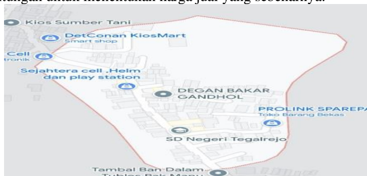
Gambar 1. Lokasi Kegiatan Sosialisasi dan Pendampingan pada Bila Catering