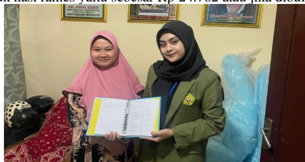
Gambar 5. Pendampingan Aplikasi dan Harga Pokok Produksi pada Bila Catering

Dengan Markup sebesar 100% sehingga perhitungan untuk keuntungan yang didapat sebesar Rp 12.381. Sehingga harga jual untuk nasi rames yaitu sebesar Rp 24.762 atau jika dibulatkan menjadi 25.000.