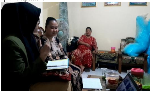
Gambar 2. Sosialisasi Financial Project: Pembukuan Sederhana Bagi UMKM Desa Tegalrejo

Pada kegiatan sosialisasi ini dilakukan penyuluhan terkait dengan memberikan materi gambaran umum dan manfaat dari pencatatan keuangan dan akuntansi yakni pembukuan sederhana dan perhitungan harga pokok produksi. Kegiatan sosialisasi atau penyuluhan ini dilakukan di kediaman Bila Catering pada tanggal 2 Juni 2023. Dimana materi yang dibawakan dengan tema “ Financial Project: Pembukuan Sederhana bagi UMKM Desa Tegalrejo ”. Dimana menjelaskan kepada pemilik Bila Catering bahwa pembukuan ialah suatu bentuk pencatatan dari transaksi keuangan saat dilakukannya usaha tersebut. Meliputi transaksi pembelian, pemasukan, pengeluaran, dan pendapatan.