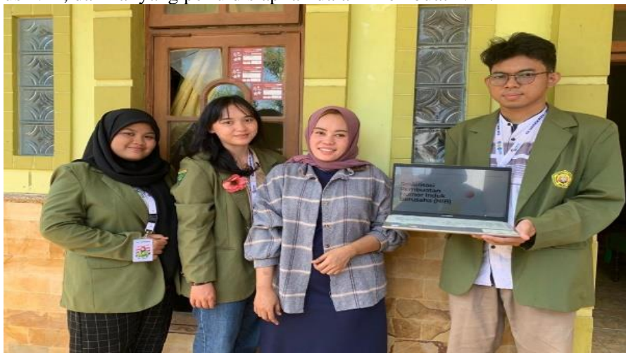
Gambar 2. Sosialisasi dan Pendampingan Nomor Induk Berusaha (NIB)

Tahapan selanjutnya, yaitu melakukan sosialisasi dengan menyajikan materi mengenai NIB kepada pelaku usaha di Desa Sumberbendo. Materi ini disajikan dalam bentuk presentasi PowerPoint . Materi yang disajikan berupa pengenalan tentang NIB, contoh kepemilikan NIB, manfaat yang didapatkan dari memperoleh NIB, tata cara mengurus NIB, dan hal yang perlu disiapkan dalam membuat NIB.