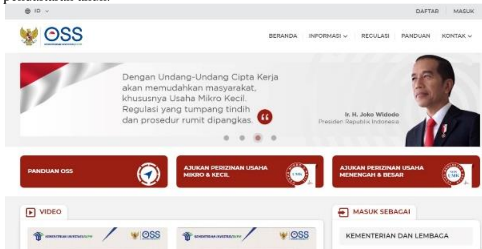
Gambar 3. Situs Web Online Single Submission (OSS)

pelaku usaha perlu untuk melakukan pendaftaran akun pada situs web OSS. Kegiatan awal yang dilakukan, yaitu tahapan pendaftaran akun.