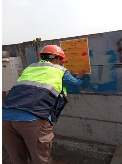
Gambar 2. Pemasangan poster mengenai Sosialisasi Alat pelindung Diri