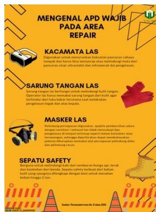
Gambar 1. Poster mengenai sosialisasi Alat Pelindung Diri

Variabel yang diukur dalam kegiatan ini adalah pengetahuan terkait Alat Pelindung Diri (APD) pada pekerja di area repair yang ada di PT. X dengan menggunakan modifikasi kuisioner mengenai Alat Pelindung Diri (APD) yang diambil dari beberapa vendor dan pekerja dengan total 9 yang mengisi kuisioner. kemudian hasil dari kuisioner ini diapatkan hasil bahwa masih banyak yang kurang mengetahui terkait Alat Pelindung Diri (APD).