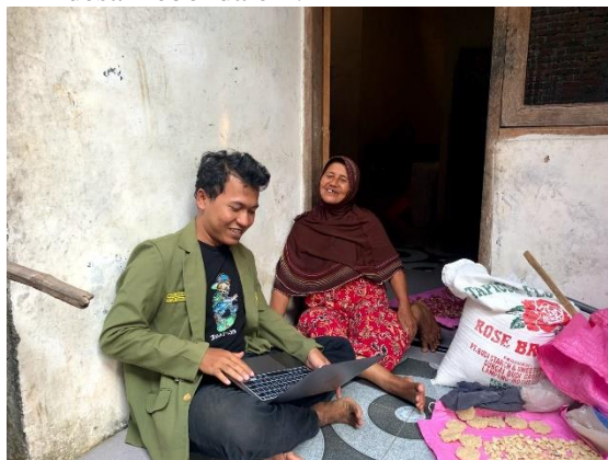
Gambar 2. Pelaksanaan pelatihan pada salah satu UMKM

Merujuk pada kendala UMKM yang berada di desa Kebondalem yang belum mengetahui bagaimana cara pengelolaan keuangan pada usahanya, Sosialisasi dan edukasi harus dilaksanakan. Melalui sosialisasi dan edukasi, diharapkan mereka yang berkecimpung di dunia usaha mampu mengelola perekonomian dengan baik dan benar sehingga usahanya bisa bertahan bahkan bisa lebih berkembang. Berdasarkan survey yang dilakukan oleh penulis, 7 dari 10 UMKM desa Kebondalem setelah sosialisasi dan pelatihan pada hari pertama pelaku UMKM desa Kebondalem mampu memahami materi yang disampaikan oleh penulis. Pada pertemuan kedua sebelum melakukan project yang akan didampingi penulis, penulis menjelaskan ulang materi yang diberikan pada pertemuan pertama, setelah itu penulis memberikan suatu project yang akan didampingi oleh penulis. Pada pertemuan ketiga pelaku UMKM diminta untuk secara mandiri melakukan pengelolaan keuangan usahanya dengan baik dan benar. Sosialisasi dan pelatihan pengeolaan keuangan ini bermanfaat dan menambah wawasan bagi para pelaku UMKM desa Kebondalem.