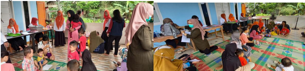
Gambar 2. Suasana Kegiatan Sosialisasi Manajemen Keuangan Rumah Tangga

Pelatihan diakhiri dengan evaluasi kegiatan yang dilakukan dengan tanya jawab oleh narasumber dan ibu-ibu pada Posyandu Harum Manis di Desa Sungai Raya Dalam, Kabupaten Kubu Raya. Hasilnya adalah sebesar 90% memberikan penilaian baik dan para peserta paham bagaimana pencatatan pengelolalan keuangan secara sederhana.