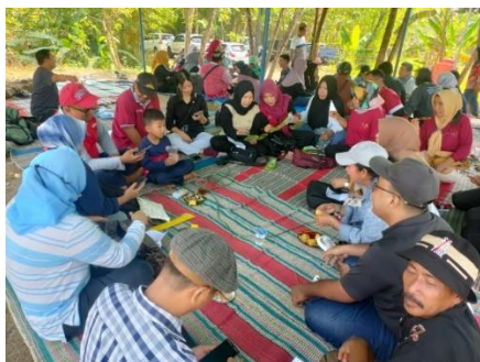
Gambar 3. Pelatihan Pemasaran Digital dan diskusi kelompok

Kegiatan pelatihan pemasaran digital pelaku industri pariwisata di Kota Semarang yang memiliki keterbatasan pengetahuan dan keterampilan dalam pemasaran digital. Maka kegiatan ini difasilitasi oleh Dinas Pariwisata Kota Semarang bekerjasama dengan STIEPARI Semarang, LSP LSP Pariwisata dan lainnya yang terlibat sebagai wujud kolaborasi sinergi membangun Pariwisata Kota Semarang bangkit bersama untuk meningkatkan kunjungan wisatawan. Kegiatan pelatihan disajikan sesuai (gambar 3), dan diakhiri dengan kegiatan monitoring pada (gambar 4), sebagai berikut: