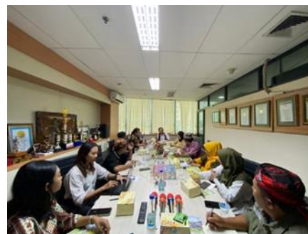
Gambar 4. Monitoring dan Evaluasi

Kegiatan pelatihan pemasaran digital melalui paket wisata terintegrasi sangat bermanfaat dalam mendukung daya tarik wisata untuk meningkatkan kunjungan wisatawan, tentunya dengan penghitungan harga