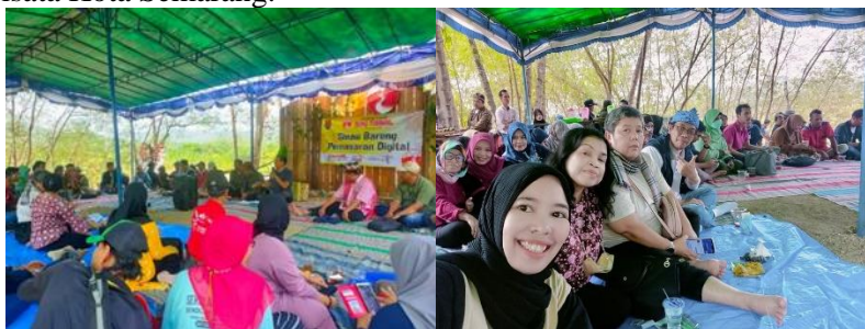
Gambar 1. Pelatihan Pemasaran Digital, Lokasi Dung Tungkul Kota Semarang

Untuk mengatasi masalah-masalah ini, penting untuk mengembangkan strategi pemasaran yang inovatif dan efektif, memperkuat keterampilan pemasaran digital, meningkatkan visibilitas dan kesadaran melalui pemasaran konten dan media sosial, serta memperkuat kerjasama antara semua pemangku kepentingan terkait dalam industri pariwisata Kota Semarang.