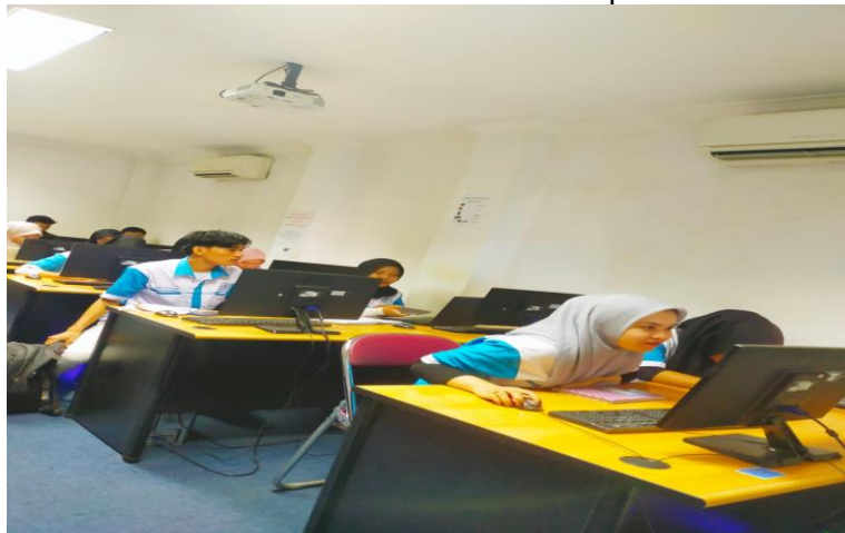
Gambar 4 Pelaksanaan Kegiatan Hari Kedua (Penggunaan Aplikasi Mendeley)

Penyebaran kuisisioner yang dilakukan untuk mengetahui sejauh mana peserta memahami materi yang telah disampaikan. Peserta yang mengikuti pelatihan ini berjumlah 15 orang peserta. Materi pertanyaan yang diberikan kepada peserta sebelum dilakukan pelatihan adalah : Mengetahui tentang aplikasi Mendeley, Penggunaan aplikasi Mendeley. Untuk soal kuisisioner yang diberikan setelah dilakukan pelatihan adalah : Memahami aplikasi Mendeley, Penggunaan aplikasi Mendeley memudahkan dalam penulisan Tugas Akhir, Kerja Praktek, dan pembuatan artikel serta memudahkan dalam pembuatan daftar pustaka.