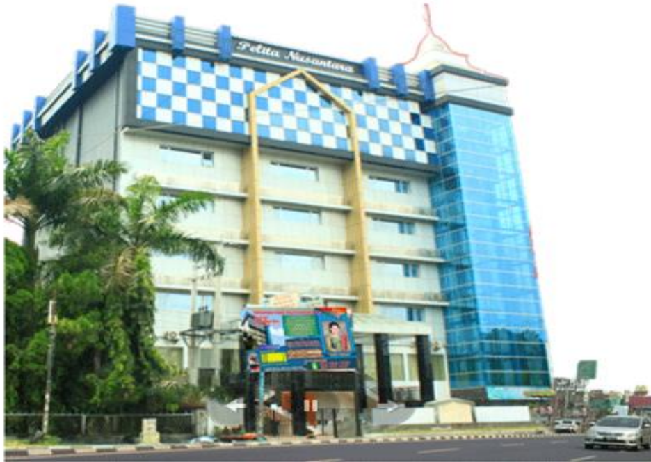
Gambar 1. Lokasi Pengabdian