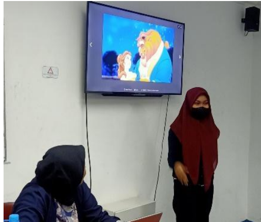
Gambar 4.. Peserta berlatih Story Telling