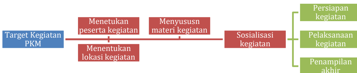
Gambar 2. Alur Pelaksanaan Kegiatan PKM

Refleksi dilakukan terhadap kegiatan yang telah dilaksanakan. Hal ini dilakukan semata-mata untuk mengetahui kekurangan atau kelebihan terhadap kegiatan-kegiatan yang telah dilakukan dalam rangka menetapkan rekomendasi terhadap keberlangsungan atau pengembangan kegiatan-kegiatan berikutnya. Hasil refleksi adalah perlu dilakukan suatu upaya untuk membantu meningkatkan keterampilan berbahasa Inggris yang baik siswa dalam melakukan Public Speaking Skill dengan teknik story telling . Adapun mekanisme pelaksanaan kegiatan PKM dapat dilihat dalam Gambar 3.4 di bawah ini :