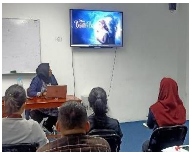
Gambar 3. Tim Pelaksana dan Peserta Pelatihan

Hasil kegiatan pelaksanaan pengabdian kepada masyarakat ini mendapatkan sambutan positif dari pihak masyarakat terutama siswa dan pihak tempat penyelenggaraan pengabdian ini dilaksanakan karena pelatihan ini sesuai dengan kebutuhan mereka dalam meningkatkan kemampuan anak.