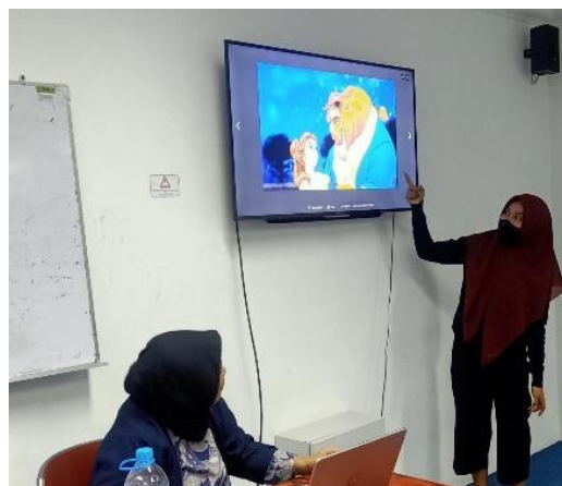
Gambar 5. Peserta melakukan Kegiatan Story Telling

Dengan adanya hasil kegiatan ini terlihat dari peningkatan kemampuan berbahasa anak-anak. Manfaat dari kegiatan ini langsung dirasakan oleh para siswa, dimana keterampilan siswa dan anak meningkat. Hal tersebut terjadi dikarenakan adanya proses kegiatan yang mengutamakan para peserta dapat mempraktekan secara langsung berbeda ketika hanya dilakukan secara pasif tanpa adanya praktek.